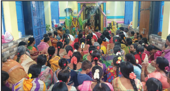
సింహాద్రిపురం మేజర్ న్యూస్ : సింహాద్రి పురం శ్రీ శ్రీ శ్రీ దేవీ భూ దేవి సమేత లక్ష్మీ వేంకటేశ్వర స్వామి ఆలయంలో సోమవారం సాయంత్రం శ్రావణ షౌరభి సంధర్పంగా సామూహిక సత్య నారాయణస్వామి వ్రత పూజలు ఘనంగా జరిగాయి. ఈ కార్యక్రమాల్లో భాగంగా జిల్లా ఎల్లనూరు కు చెందిన వేద పండితులు సత్య నారాయణస్వామి వ్రతం కథను చక్కగా వివరించారు. ఈ కార్యక్రమాలకు మహిళలు అధిక సంఖ్యలో పాల్గొన్నారు. అనంతరం ఆలయ నిర్వాహకులు ఏర్పాటుచేసిన భక్తులకు తీర్థ ప్రసాదాలు పంపిణీచేశారు. ఈ కార్యక్రమంలో ఆలయ నిర్వాహకులు భక్తులు తదితరులు పాల్గొన్నారు.