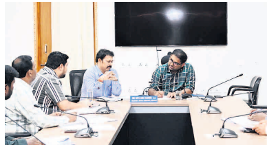
సిఎంఆర్ రైస్ డెలివరీ సెప్టెంబర్ 30 లోగా పూర్తి చేయాలని ఆహ్వానించారు. సి.ఎం.ఆర్. రైస్ డెలివరీ గడువు పెంపు ఉండదని, నిర్దేశిత