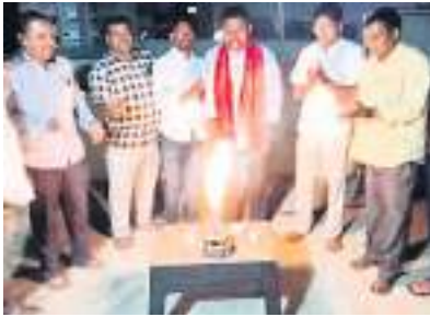
పర్యాయం కొనసాగుతున్నారు. కాకతాళియంగా జరిగిన వీరి పరిచయం స్నేహంగా మారి, ఒకే వృత్తిలో స్థిరపడడమే కాకుండా రిసోర్స్ పర్సన్ గా, ఉపాధ్యాయ సంఘాల బాధ్యులుగా రాణిస్తూ, జిల్లా ఉత్తమ ఉపాధ్యాయులుగా చివరలందిస్తూ, గ్రామ కీర్తి ప్రతిష్ఠలను ఇనుమడింపజేస్తున్న వీరి పట్ల స్నేహితుల రోజూ గ్రామస్తులు హర్షాతిరేఖలు వ్యక్తపరుస్తున్నారు.