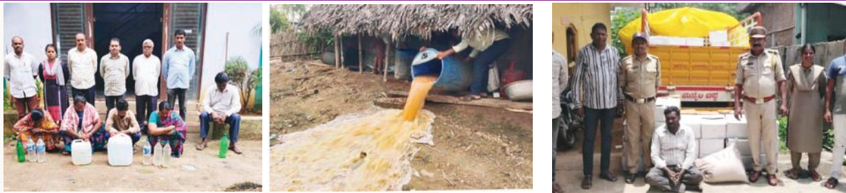
కొత్తగూడెం క్రైమ్ సూర్య (మేజర్ న్యూస్) -