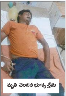
మృతి చెందిన భూక్య శ్రీను