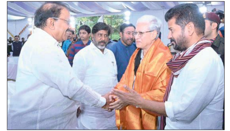
ఖమ్మం సూర్య ప్రతినిధి : తెలంగాణ రాష్ట్ర సూతన గవర్నర్ గా నియమితులైన గౌరవ జిప్సు దేవ్ వర్మ పదవీ ప్రమాణ స్వీకార కార్యక్రమంలో తెలంగాణ రాష్ట్ర వ్యవసాయ శాఖ మంత్రి తుమ్మల నాగేశ్వరరావు పాల్గొని శుభాకాంక్షలు తెలిపారు