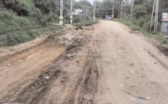
కొత్తగూడెం టౌన్, సూర్య (మేజర్ స్కూస్) -

-మరమ్మతులకు నోచుకోని బీటలు వారిన రోడ్లు, -నిర్లక్ష్యం వహిస్తున్న మున్సిపల్ అధికారులు