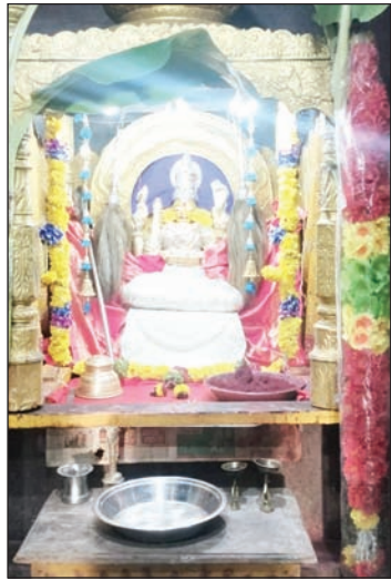
అవనిగడ్డ మేజర్ స్టూన్ : శ్రావణమాసంలో సిరులు ప్రసాదిస్తూ వరాలను ఇచ్చే వరలక్ష్మీ వ్రతాలు హిందూ సాంప్రదాయం ప్రకారం హిందువులు ఇంటింట

పెద్ద ఎత్తున నిర్వహించారు. మహిళలు దీర్ఘకాలం సుమంగళిగా ఉండేందుకు ఈ వ్రతాన్ని తప్పక ఆచరిస్తారు. శ్రావణమాసంలో పౌర్ణాసికి ముందున వచ్చే శుక్రవారం వరలక్ష్మీ వ్రతాన్ని భక్తి శ్రద్ధలతో నిర్వహిస్తారు. తెలుగువారి సాంప్రదాయం ప్రకారం శుక్రవారం వేకువ జామునే మహిళలు తలస్నానం చేసి, ఇళ్ళు వాకిలి శుభ్రంగా చేసుకుని పూజగదిలో కలశాన్ని సిద్ధం చేసుకుని పూజకు వాడే పూజా సామాగ్రితో సిద్ధం అవుతారు. పసుపు, కుంకుమ, గంధం కలిపిన మిశ్రమంతో స్వస్తిక్ చిహ్నంతో కలశంలో బియ్యం లేక నీరు, ఐదు నాణేలు వేసి తరువాత కొబ్బరికాయకు పసుపు రాసి దానిపై ఏర్పాటు చేసుకుంటారు. అనంతరం అమ్మవారిని శుభ్రంగా అలంకరించి పూజలో భాగంగా ఐదు రకాల పండ్లు నైవేద్యంగా సమర్పించి వ్రతం నిర్వహించి కర్పూర హారతులు ఇచ్చి అక్షింతలను తలపై వేసుకుని వరలక్ష్మీ అమ్మవారి ఆశీస్సులను పొందుతారు. సాయంత్రం దగ్గరలో ఉన్న అమ్మవారి ఆలయాలకు వెళ్ళి ప్రత్యేక పూజలు, కుంకుమ అర్చనలు, అర్చనలు భక్తి శ్రద్ధలతో నిర్వహించారు. ఈ సందర్భంగా ఆలయాలు అన్ని భక్తులతో కిటికిలాడాయి.