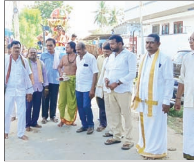
శ్రావణ పార్లమె సందర్భంగా ఉత్సవమూర్తుల ఊరేగింపు