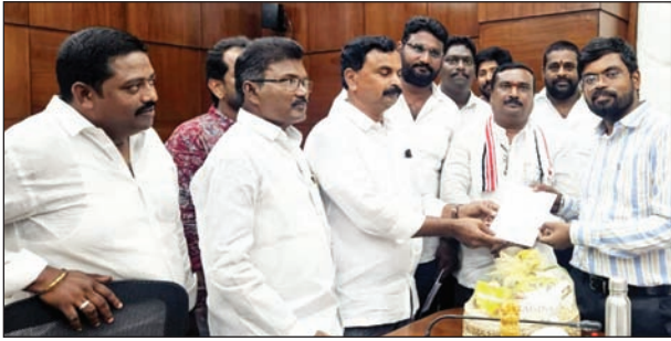
మచిలీపట్నం, మేజర్ స్వ్యాస్ : సెప్టెంబర్ ఒకటో తేదీన మొక్కల పంపిణీ పురస్కరించుకొని జిల్లా కలెక్టర్ డి కే బాలాజీ, జాయింట్ కలెక్టర్ గీతాంజలి