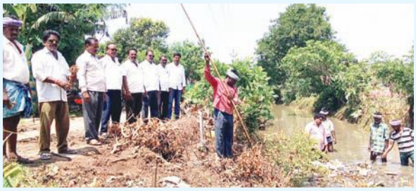
సాగునీటి సరఫరాకు ఇబ్బంది లేకుండా