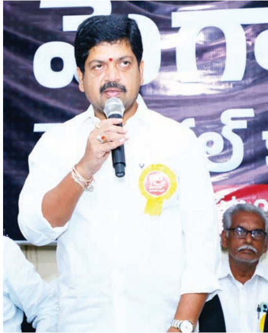
చేసిన వ్యవస్థ గురించి మాట్లాడే అర్హత వారికి ఉందా అని ప్రశ్నించారు. ప్రజలకు సత్వర న్యాయం చేసేలా పాలిటికల్ గవర్నెన్స్ ప్రజలకు సత్వరన్యాయం అందించే లక్ష్యంతో త్వరలోనే ముగతా 2లో

పాలన చూసి ఏడుపెందుకు ప్రజలకు ప్రజాస్వామ్యబద్ధమైన పాలన అందించేందుకు కూటమి ప్రభుత్వం ప్రయత్నిస్తుంటే.. జగన్ రెడ్డి రాక్షసాలనుకుంటున్నాడని మండిపడ్డారు. మంత్రులందరికీ గ్రూప్ పెట్టి, సమస్యలపై చర్చిస్తుంటే.. దానికి కూడా వక్రీకారం చెప్పడానికి సిగ్గుపడాలన్నారు. ఐదేళ్ల పాటు కనీసం ప్రజా సమస్యలపై చర్చించని వారికి ఇలాంటి పాలన చూస్తే ఏడుపు తప్ప ఇంకేముంటుందన్నారు. గతంలో వాట్సుప్ అంటే ఏం చేశారో ఒక ఎంపీ నిరూపించాడు. వారి బుద్ధి అంత వరకే ఉంటుందని బందరు పిచ్చోడు మరోసారి నిరూపించాడు. ప్రజల అభిప్రాయాలు, వారి సమస్యలు తెలిపేందుకు సత్వర మార్గంగా ఏర్పాటు