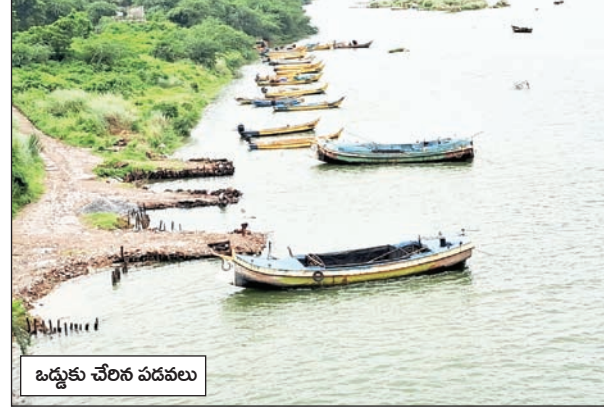
ఒడ్డుకు చేరిన వడవలు

అవనిగడ్డ మేజర్ స్కూల్ : కృష్ణమ్మ సముద్రంలో కలిసేందుకు పరుగులు పెడుతుంది. ఎగువ రాష్ట్రాల్లో అధిక వర్షపాతం నమోదు కావడంతో ఎగువన ఉన్న జలాశయాల్నీ నిండు కుండలా తయారు కావడంతో శ్రీశైలం నుండి నాగార్జున సాగర్ కు వరద పోటెత్తడంతో నాగార్జున సాగర్ నుండి ప్రకాశం బ్యారేజీకి వరద నీటిని ఇరిగేషన్