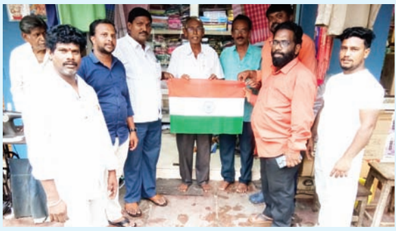
ప్రతి ఇంటిపై జాతీయ జెండా ఎగరాలి