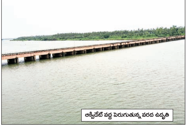
ఆక్సిడేట్ వద్ద పెరుగుతున్న వరద ఉధృతి