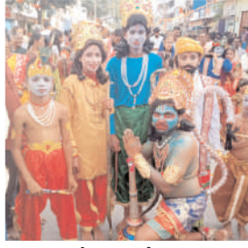
వివిధ వేషధారణల్లో చిన్నారులు