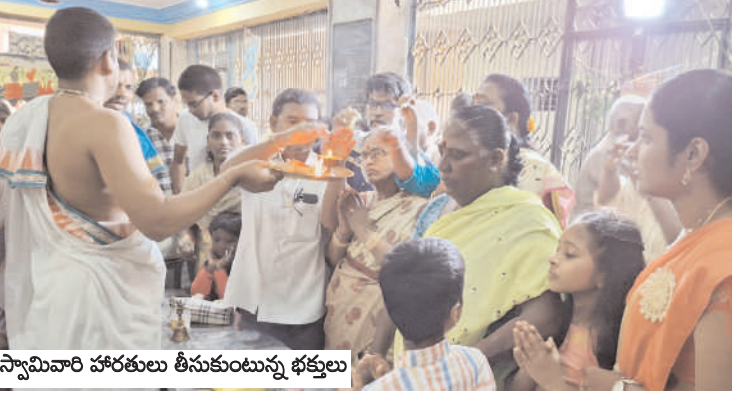
స్వామివారి హారతులు తీసుకుంటున్న భక్తులు