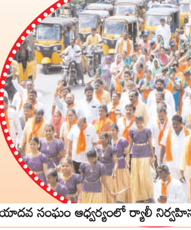
యాదవ సంఘం ఆధ్వర్యంలో ర్యాలీ నిర్వహిస్తున్న దృశ్యం