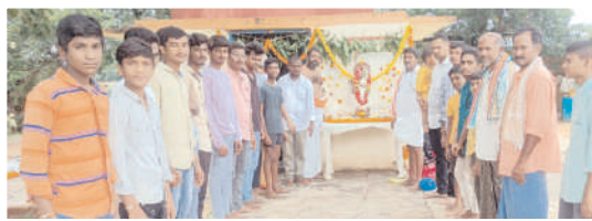
సంబరాలలో పాల్గొన్న భక్తులు