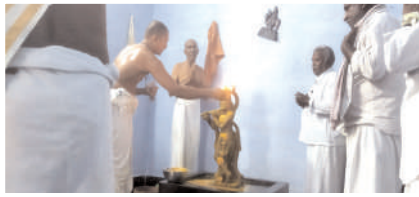
స్వామి వారికి ప్రత్యేక పూజలు నిర్వహిస్తున్న దృశ్యం

నిర్వహించారు. వేణుగోపాల స్వామికి పంచామృతాభిషేకం, సామూహిక భగవద్గీత పారాయణం నిర్వహించారు. సాయంకాలం స్వామి వారికి ఉయ్యాల వవళింపు సేవ, తోమాల సేవ నిర్వహించారు. అధిక సంఖ్యలో మహిళా భక్తులు పాల్గొన్నారు. భక్తులందరికీ ఆశ్రమ నిర్వాహకులు భోజన వసతి కల్పించారు.