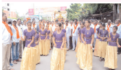
శ్రీకృష్ణుడి ఊరేగింపు నిర్వహిస్తున్న దృశ్యం