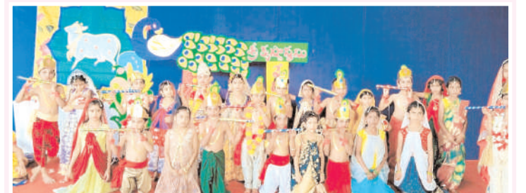
శ్రీకృష్ణ గోపిక వేషధారణల్లో చిన్నారులు