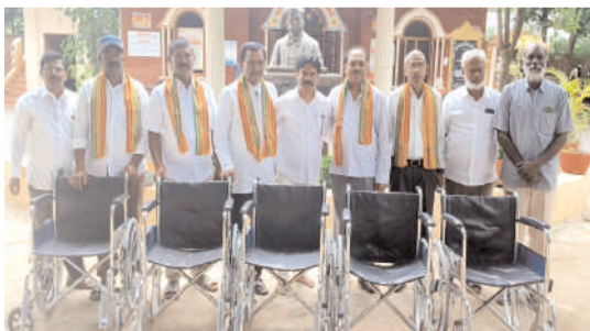
ను అందించినట్లు వారు తెలిపారు.