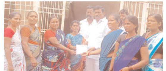
ఎమ్మెల్యేకు వినతిపత్రం అందిస్తున్న వంట మహిళలు

అలూరు, మేజర్ న్యూస్: అలూరు పట్టణంలో హాల్ బెలగల్ రోడ్డులోని గురుకుల గిరిజన బాలికల ఆశ్రమ పాఠశాలను ఎమ్మెల్యే విరుపాక్షి తనిఖీచేసి విద్యావిధానం పై స్వయంగా విద్యార్థులను అడిగి తెలుసుకున్నారు. సోమవారం అలూరులో గిరిజన బాలికల పాఠశాలను ఇటీవల అధికారులు తుగ్గలికి తరలించాలని చూడగా విద్యార్థుల తల్లిదండ్రులు అడ్డుకున్నారు. దీనిపై జిల్లా అధికారులు తో ఎమ్మెల్యే మాట్లాడారు. గిరిజన బాలికల పాఠశాలకు నూతన భవనాలు మంజూరుకు నిధులు ఇవ్వాలని కోరారు. అలాగే విద్యార్థులు ఏదైనా సమస్య మీకు ఏ సమస్య ఉన్నా నేరుగా తనకే ఫోన్ చేయవచ్చు అని విద్యార్థులకు ఫోన్ నెంబర్ ఇచ్చారు. అనంతరం కమ్యూటీ వర్కర్స్ ఏజ్