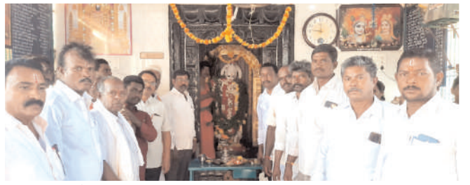
శ్రీకృష్ణునికి పూజలు నిర్వహిస్తున్న యాదవ సంఘం సభ్యులు