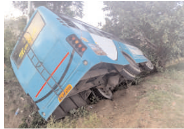
ప్రమాదంలో దెబ్బతిన్న బస్సు

హోలహర్షి, మేజర్ న్యూస్: హోలహర్షి మండలం సరిహద్దుల్లో కర్ణాటక రాష్ట్రం ఎర్రగుడి సమీపంలో ప్రైవేట్ మీనాక్షి ట్రావెల్స్ కు చెందిన బస్సు ముందు వెళ్తున్న బైక్ ను తప్పించబోయి రోడ్డుపక్కనున్న గుంతలోకి బోల్తాపడింది. బస్సులో ఆదోని, ఆలూరు నుండి ప్రయాణిస్తున్న దాదాపు 40 మంది ప్రయాణికులు ఉండగా 30 మందికి పైగా స్వల్ప గాయాలు అయినట్లు తెలిపారు. కర్ణాటక కు చెందిన కె. ఏ.38.4759