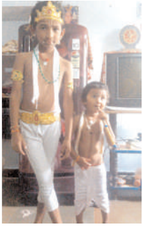
శ్రీ కృష్ణుడు వేషాధారణలో చిన్నారులు

కొత్తపల్లి, మేజర్ న్యూస్: మండలంలోని కొత్తపల్లి, పెద్ద గుమ్మడాపురం, చిన్న గుమ్మడాపురం, శివపురం, దుర్బయల గ్రామాల్లో శ్రీకృష్ణాష్టమి వేడుకలు సోమవారం ఘనంగా నిర్వహించారు. శ్రీ కృష్ణుడు విగ్రహానికి ప్రత్యేక పూజా కార్యక్రమాలు నిర్వహించారు. ఆయా గ్రామాల్లో చిన్నారులను శ్రీ కృష్ణుడి వేషాధారణలో అలంకరించి పలు సాంస్కృతిక కార్యక్రమాలను నిర్వహించారు. చిన్న గుమ్మడాపురం, కొత్తపల్లి గ్రామాలలో శ్రీ కృష్ణుడు ఉత్సవ విగ్రహాలను గ్రామంలోని పురవీధుల