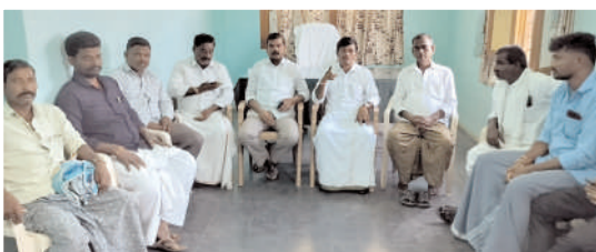
నమావేశంలో మాట్లాడుతున్న వైకాపా నాయకులు