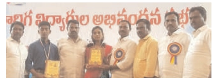
అవార్డు అందుకుంటున్న జొల్లు రేచల్