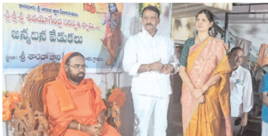
స్వామివారి ఆశీస్సులు పొందుతున్న ఎమ్మెల్యే దంపతులు

- కార్యక్రమంలో పాల్గొన్న శ్రీలైలం ఎమ్మెల్యే బుడ్డా దంపతులు