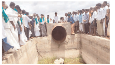
మాచాపురం చెరువు పరిశీలిస్తున్న బుట్టారేణుక

మాత్ర రైతులపై చిత్తశుద్ధి ఉండో అర్థం అవుతుందన్నారు. దొంగలించ బడ్డ కాఫర్ వైర్ స్థానంలో కొత్తది అమర్చడంతో పాటు విద్యుత్ మోటార్లు తక్షణమే మరమ్మత్తులు చేయించి అన్నదాతలను ఆదుకోవాలన్నారు. తుంగభద్ర జలాలు సముద్రం పాలు కాకుండా జిల్లా పశ్చిమ రైతులను ఆదుకునేందుకు