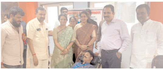
ఇద్దక్కాపు ప్రారంభిస్తున్న దృశ్యం