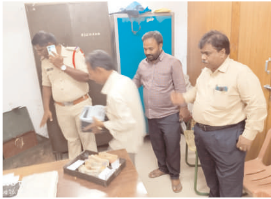
అధికారుల సమక్షంలో నగదును పరిశీలిస్తున్న దృశ్యం