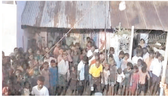
కొత్తపల్లిలో శ్రీకృష్ణాష్టమి వేడుకలలో పాల్గొన్న భక్తులు

కొత్తపల్లి, మేజర్ న్యూస్: మండలంలోని కొత్తపల్లి, పెద్ద గుమ్మడాపురం, చిన్న గుమ్మడాపురం, శివపురం, దుర్బయల గ్రామాల్లో శ్రీకృష్ణాష్టమి వేడుకలు సోమవారం ఘనంగా నిర్వహించారు. శ్రీ కృష్ణుడు విగ్రహానికి ప్రత్యేక పూజా కార్యక్రమాలు నిర్వహించారు. ఆయా గ్రామాల్లో చిన్నారులను శ్రీ కృష్ణుడి వేషాధారణలో అలంకరించి పలు సాంస్కృతిక కార్యక్రమాలను నిర్వహించారు. చిన్న గుమ్మడాపురం, కొత్తపల్లి గ్రామాలలో శ్రీ కృష్ణుడు ఉత్సవ విగ్రహాలను గ్రామంలోని పురవీధుల