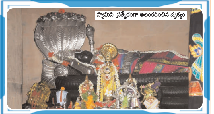
స్వామిని ప్రత్యేకంగా అలంకరించిన దృశ్యం