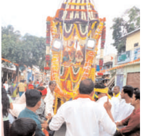
శ్రీకృష్ణ జయంతి రథోత్సవంవేడుకల్లో యాదవ సంఘం నాయకులు

- యాదవ సంఘం నాయకుల ఆధ్వర్యంలో రథోత్సవం ఊరేగింపు