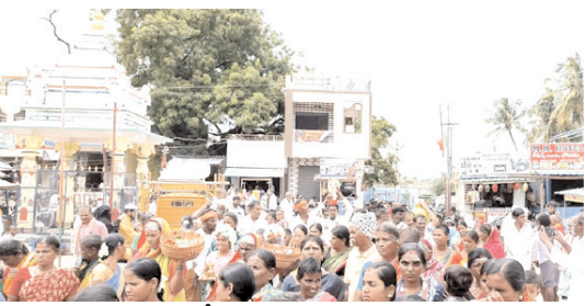
కుంభోత్సవాన్ని నిర్వహిస్తున్న భక్తులు

హొళగుండ, మేజర్ న్యూస్ : శ్రావణమాసంలో భాగంగా చివరి శుక్రవారం స్థానికంలో ఉలిగెమ్మ దేవి కుంభోత్సవం కార్యక్రమాన్ని రజక కులస్తుల ఆధ్వర్యంలో ఘనంగా నిర్వహించారు. స్థానిక బస్టాండ్ వద్ద ఉన్న పెద్దబావి వద్ద గంగి పూజాను చేసి దప్పల మేళాతాలలతో గ్రామ పురవీధుల్లో కుంభోత్సవాన్ని నిర్వహించారు. అనంతరం రజక వీధిలో దేవాలయంలో దేవికి ఆకులపూజా, మహామంగళాచరిత్ర ప్రత్యేక పూజా నైవేద్యాల సమర్పించి మోక్కుబడులు తీర్చుకున్నారు. భక్తులు అధిక సంఖ్యలో పాల్గొన్నారు. వచ్చిన భక్తులకు అన్నప్రసాదాన్ని ఏర్పాటు చేశారు. కార్యక్రమంలో రజక సంఘం పెద్దలు, కులస్తులు హాజరయ్యారు.