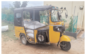
పోలీస్ స్టేషన్ ఆవరణలో ఉన్న ఆటో

-పట్టుబడిన ఆటో పోలీస్ స్టేషన్ కు తరలింపు - గోడౌన్ ను సీజీ చేసిన లభికారులు