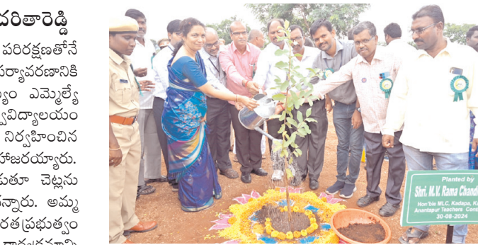
మొక్క నాటి సీరు పోస్తున్న దృశ్యం