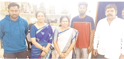
క్రీడాకారులను అభినందిస్తున్న దృశ్యం