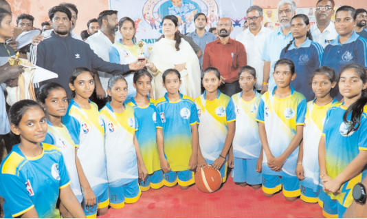
నంద్యాల టౌన్ మేజర్ న్యూస్ పేజీకి మాంత్రికుడు ధ్యాన్యండ్ జయంతిని

కలెక్టర్ చేతుల మీదుగా ట్రోఫీ ప్రశంసా పత్రాలు అందుకున్న ఎన్ డి ఆర్ స్కూల్ విద్యార్థులు