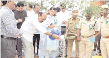
మొక్కలు నాటిన అనంతరం మొక్కలకు నీటిని పోస్తున్న మంత్రి