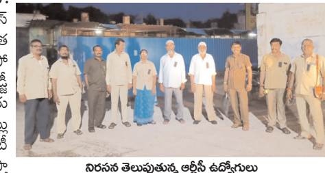
నిరసన తెలుపుతున్న ఆర్టీసీ ఉద్యోగులు

ఎమ్మిగనూరు టౌన్, మేజర్ న్యూస్ : నైట్లో అలవెన్సు ఏపీఎస్ ఆర్టీసీ ఉద్యోగులకు నిలిపివేత పై ఎమ్మిగనూరు ఆర్టీసీ డిపో ముందు ఉద్యోగులు నల్ల బ్యాడ్జిలతో శుక్రవారం తెల్లవారు జామున నిరసన తెలిపినట్లు నేషనల్ మద్దూర్ యూనిటీ