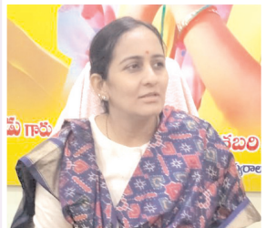
ఎంపీ బైరెడ్డి శబరి

నంద్యాలఅర్బన్, మేజర్ న్యూస్ : 02813 నెంబరు గల రైలు సెప్టెంబరు నెల 7వ తేదీ భువనేశ్వర్ నుంచి బయలుదేరి నంద్యాలకు సెప్టెంబరు నెల 8వ తేదీ మధ్యాహ్నం 2 గంటలకు చేరుకుని మరుసటి రోజు ఉదయం 3 గంటలకు బెల్లం చేరుకుంటుంది. ట్రయిన్ నెంబరు 02814 బెల్లం నుంచి భువనేశ్వర్ స్పెషల్ పూజా ఎక్స్ ప్రెస్ ప్రతి సోమవారం ఉదయం 7:30 గంటలకు బెల్లం నుంచి బయలుదేరి నంద్యాలకు సాయంత్రం 6:30 గంటలకు చేరుకుని విజయవాడ, వైజాగ్ మీదుగా భువనేశ్వర్ మంగళవారం మధ్యాహ్నం చేరుకుంటుంది నంద్యాల పార్లమెంట్ సభ్యురాలు, లోక్ సభ డిప్యూటీ ఛోసర్ లీడర్ డా. బైరెడ్డి శబరి శుక్రవారం తెలిపారు. ఈ రైలు 07-09-2024 నుంచి 30-11-2024 తేదీ వరకు ప్రతి వారం 13 ట్రిప్పులు తిరుగుతుంది తెలిపారు. నంద్యాల వాసులు ఈ వారాంతపు రైతులును ఉపయోగించుకోవాలని కోరారు. ఈ రైలు నంద్యాల జిల్లాలో నంద్యాల, డోన్ స్టేషన్లలో ఆగుతుంది తెలిపారు.