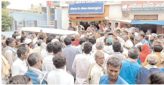
శుక్రవారం గ్రామానికి వెళ్లగా గ్రామస్తులు పెద్ద ఎత్తున