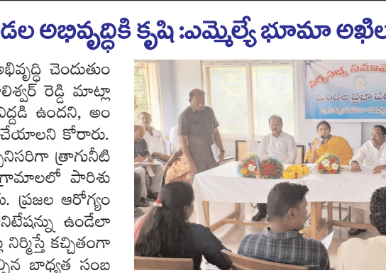
తీసుకుంటానన్నారు. మండలంలోని సర్పంచులు ఎంపీటిసిలు అభివృద్ధి కోసం పని చేయాలని, గత ప్రభుత్వంలో లాగా నిధులు కొరత ఈ ప్రభుత్వానికి ఉండదన్నారు. 15వ ఆర్థిక సంఘ నిధులు నేరుగా సర్పంచ్ భాతాలో జమవుతాయన్నారు. ఈ నిధులతో పాటు ఎమ్మెల్యే గ్రాంట్ కూడా విడుదలవుతాడని మొన్న ఎక్కడ అభివృద్ధికి కుంటు లేకుండా అభివృద్ధి జరిగేలా చూడాలన్నారు. ప్రజా సమస్యలు అధికారులు ఎప్పుడీ కప్పుడు తీర్చాలన్నారు. శాకాలవారిగా సమీక్ష సమావేశాన్ని నిర్వహించారు. విద్యుత్తు స్తంభాలకు వైర్లు చాలా పూతనమైనవిని అలాంటి వైర్లు మార్చాలని ఏతాని ఆదేశించారు. పశువులకు సీజనల్ వ్యాధుల ప్రబలకుం