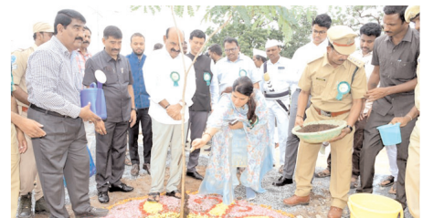
మొక్కలకు మట్టిని వేస్తున్న కలెక్టర్ రాజకుమారి

సంరక్షణ చేయాల్సిన బాధ్యత అందరిపై ఉందన్నారు. కలెక్టర్ మాట్లాడుతూ రాష్ట్ర ప్రభుత్వం అదేశాల మేరకు జిల్లాలో మొక్కలు నాటి కార్యక్రమాన్ని ఉద్యమంలా చేపట్టాలని విజ్ఞప్తి చేశారు. నంద్యాల జిల్లాలో 9.64 లక్షల హెక్టార్ల భూమి ఉందని అందులో 3.14లక్షల హెక్టార్లలో 32.8శాతం పర్యావరణ సంబంధమైన అటవీ భూములు విస్తీర్ణం ఉంది మన నంద్యాల జిల్లా అదృష్టం చేసుకుందన్నారు. గత సంవత్సరం భూగర్భ జలాల నీటిమట్టం దిగువకు పోవడం వల్ల నీటి కొరత ఏర్పడిన 11 గ్రామాలకు ట్యాంకర్ల ద్వారా నీటిని సరఫరా చేశామన్నారు. ప్రతి విద్యార్థి ఒక మొక్కను దత్త