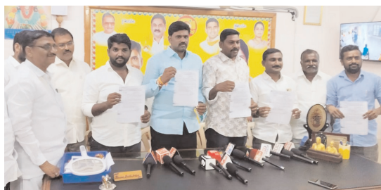
విలేకరుల సమావేశంలో మాట్లాడుతున్న తెదేపా నాయకులు

ఆరోపణలు చేయడం కాదు రుజువులు చూపించాలి..తెదపా డిమాండ్