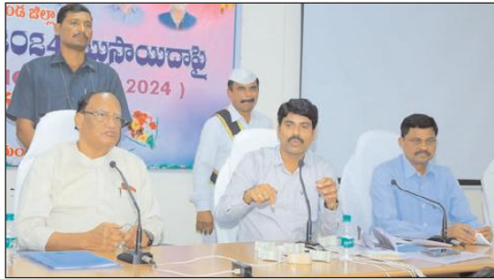
ఉమ్మడి నల్గొండ జిల్లా బ్యూరో

రాష్ట్ర శాసన మండలి చైర్మన్ గుత్తా సుఖేందర్ రెడ్డి