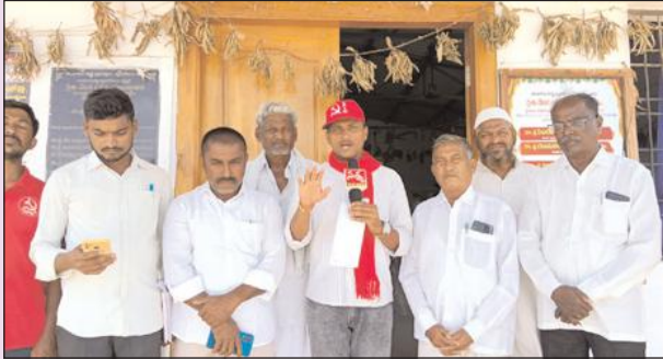
దామరచర్ల : దామరచర్ల మండల కేంద్రంలో మంగళవారం నాడు సీపీఎం పార్టీ.