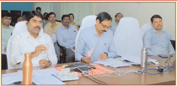
ఉమ్మడి నల్గొండ జిల్లా బ్యూరో