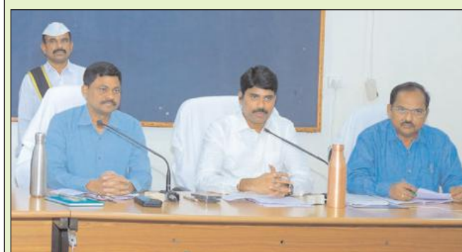
నల్గొండ జిల్లా బ్యూరో

సెప్టెంబర్ 30 నాటికి మిల్లర్లు వానాకాలం, యాసంగి లక్ష్యాన్ని పూర్తిచేయాలి