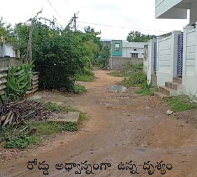
రోడ్లు అధ్యాన్నంగా ఉన్న దృశ్యం

ఆత్మకూరు పంచాయతీలో, పరిధి నెల్లూరుపాశం పంచాయతీలో ఉండగా తమ సమస్యలు పరిష్కరించలేని పరిస్థితి ఉండేదని, ప్రస్తుతం మున్సిపల్ పరిధిలోని చేరినా ఫలితం లేకపోతుందని వారు వాపోతున్నారు. తమ కాలనీ పట్టణానికి దాదాపు 2కిలోమీటర్ల దూరంలో ఉండగా ఇక్కడ పాఠశాల లేనందున తమ బిడ్డలు కాలనీనడకన వెళ్ళడం ఇబ్బందికరంగా ఉంటుందంటున్నారు. అన్ని ప్రాంతాల్లో సిమెంటు రోడ్లు, సైదుకాలువలు నిర్మించుకుంటున్నా తమ కాలనీలో మాత్రం ఏర్పాటు చేయడం లేదని వారు ఆవేదనతో చెబుతున్నారు. జిల్లా కలెక్టరైనా స్పందించి తమ అవస్థలు తొలగించాలని వారు కోరుతున్నారు.