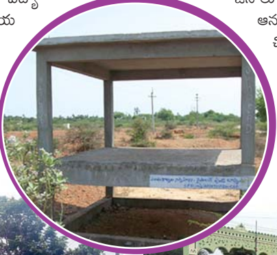
నాగులపాడు రోడ్డువద్ద బస్ షెల్టర్లు లేని దృశ్యం

ఈ మార్గంలో వెళుతుండే అధికారులు గమనిస్తున్నా ఏదేని చర్యలు తీసుకుందామా అని యోచించిన దాఖలాలు లేవు. వారు స్వయంగా గుర్తించకున్నా అందరూ అరిచిగిపెడుతున్నా కూడా ఈ సమస్యలు పరిష్కరించే పరిస్థితి కానరావడంలేదు. సోమశిల మార్గంలో సువ్వరుపాడు మజరా అంబేద్కర్ నగర్ వద్ద బస్ షెల్టర్లు లేక ఒక చెట్టే షెల్టరుగా వినియోగించుకుంటున్నారు. వర్షాకాలం వారి అవస్థలు వర్షనాతీతంగా ఉంటున్నాయి. అత్యుక్తారు-నెల్లూరుపాళెం మార్గంలో నాగులపాడు రోడ్ సెంటర్లో బస్ షెల్టర్లు లేక చిన్నపాటి చెట్టే ప్రయాణీకులకు ఆశ్రయంగా ఉండగా వర్షం కురిసినప్పుడు వారి అవస్థలు తీవ్రంగా ఉంటున్నాయి. ఇదే మార్గంలో ప్రభుత్వ జిల్లా వైద్యశాల ఉండగా అక్కడ బస్ షెల్టర్లు లేక జనాలు తీవ్రంగా ఇబ్బందిపడుతుండగా గమనించిన ఆసం వెంకటరమణమ్మ చారిటబుల్ ట్రస్టు వారు చిన్నపాటి షెల్టర్లు నిర్మించారు. దాన్ని రాత్రికిరాత్రే ఎవరో తొలగించారు. అవలివైపు కూడా ఒక షెల్టర్లు నిర్మించాల్సిన అవసరం ఎంతైనా ఉంది. ఇప్పటికైనా సంబంధిత అధికారులు స్పందించి తగు చర్యలు తీసుకోవాలని కోరుతున్నా.