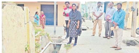
పారిశుధ్య పనులను పరిశీలిస్తున్న నగరపాలక సంస్థ కమిషనర్ అరుణ

- క్రమం తప్పకుండా ఆయిల్ బాల్స్ వేయడం, స్ప్రేయింగ్ ప్రక్రియ - వార్డుల్లో కమిషనర్ డా. జె అరుణ విస్తృత తనిఖీలు