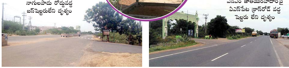
ఎన్ఎం జాతీయరహదారిపై ఏఎస్పేట క్రాస్ రోడ్ వద్ద షెల్టర్లు లేని దృశ్యం