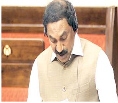
స్థానిక అధికారులకు సమాచారం ఇవ్వబడిందని పర్యావరణం అటవీ, వాతావరణ మార్పుల కేంద్ర మంత్రి కీర్తి వర్ధన్ సింగ్ తెలిపారు.