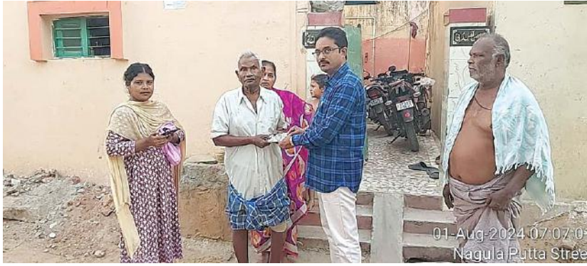
01-Aug-2024 07:07:01 Nagula Puita Street