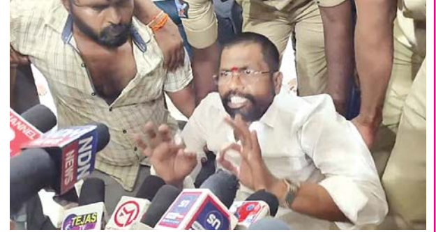
పంపించివేశారు. దీంతో ఇరు వర్గాల మధ్య నెలకొన్న వివాదం చేజారిపోతున్న నేపథ్యంలో పోలీసుల ప్రవేశం చేసి పరిస్థితులను అదుపులోకి తీసుకున్నారు.