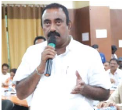
వనరులు కొబ్బరి పంటని వారు తెలిపారు.

పెంచి రైతులను ఆదుకోవాలని తెలిపారు. నియో జకవర్గంలో కాలువల పూడిక గత ఐదు సంవత్సర కాలంలో చేపట్టలేదని వెంటనే పని చేపట్టి సాగునీరు రైతులకు అందేలా చూడాలని నీటి కేటాయింపుల విషయంలో కొంత అన్యాయం జరుగుతుందని, అందుకే డెల్టా నాన్ డెల్టాపై రీ సర్వే చేపట్టాలని తెలిపారు. నాటి పొలాలు నేడు నివాసి యోగమైన ప్రాంతాలుగా మారిపోయా యని అన్నారు. కొబ్బరి చెట్ల పెంపకంలో రైతులకు అవగాహన కల్పించి అవగాహన కార్యక్రమాలను ఏర్పాటు చేయాలని, దీనిపై హార్టికల్చర్ అధికారులు ప్రత్యేక దృష్టి సాధించాలన్నారు. గోదా వరి జిల్లాలో ఉన్న రైతులు ఎక్కువగా ఆదాయం