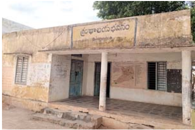
1. మూతపడి దర్శనమిస్తున్న గ్రంథాలయం,

నెల్లూరు జిల్లా గ్రంథాలయ సంస్థ ఆధీనంలో 61 గ్రంథాలయాలు 65 పుస్తక పంపిణీ కేంద్రాలు పనిచేస్తున్నాయి. ఇందుకు గాను 124 మంది సిబ్బంది అవసరం కాగా 40 మంది రెగ్యులర్ సిబ్బంది 12 మంది జిబ్బొర్నింగ్ సిబ్బంది పనిచేస్తున్నారు. 61 గ్రంథాలయాల్లో 33 సొంత భవనాలు, రెండు అద్దె భవనాలు 26 అద్దె ఉచిత భవనాల్లో పనిచేస్తున్నాయి వీటి నిర్వహణకు నెలకు సుమారు 70 లక్షలు అవసరం అవుతుంది. కానీ జిల్లాలోని నగరపాలక సంస్థలు