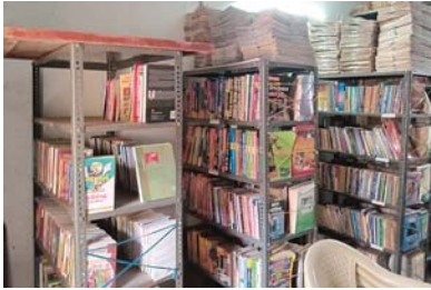
2. గ్రంథాలయంలో ఉన్న పాఠ పుస్తకాలు

మున్సిపాలిటీలు జిల్లాలోని పంచాయతీలు సకాలంలో గ్రంథాలయ పన్ను సంస్థ నిధులకు జమ చేయకపోవడం వల్ల భవన మరమ్మతులు పాఠకులకు అన్ని వసతులు కల్పించలేక అభివృద్ధిలో కుంటుపడుతున్నాయి. జిల్లాలోని మున్సిపాలిటీలు పంచాయతీల నుండి సుమారు 41 కోట్లు సెన్ బకాయిలు రావలసి ఉంది. ఇందులో ఒక్క నెల్లూరు నగరపాలక సంస్థ రూ.34.51 లక్షల రూపాయలు సెన్ బకాయిలు. చెల్లించవలసి ఉంది ఇప్పటివరకు గ్రంథాలయాల్లో జిల్లావ్యాప్తంగా 52639 మంది సభ్యత్వాలు పొంది సేవలు పొందుతున్నారు. గత ప్రభుత్వం హయాంలో 2021-22 సంవత్సర కాలంలో 89 లక్షల రూపాయలతో నూతన పుస్తకాలు, 56 లక్షల రూపాయలతో కంప్యూటర్లు ప్రింటర్లు లాప్టాప్ లు కొనుగోలు చేయడమైనది. చాలా చోట్ల పాఠకులు కంప్యూటర్ సేవలు పొందుతున్నారు. సాంకేతిక సమస్యలు ఉన్న చోట ఈ సేవలు పొందలేక పోతున్నారు. ప్రతి సంవత్సరం నవంబర్ 14 నుండి 20 వరకు జాతీయ గ్రంథాలయ వారోత్సవాలు, వేసవి సెలవుల్లో వేసవి శిక్షణ శిబిరాలు నిర్వహిస్తు