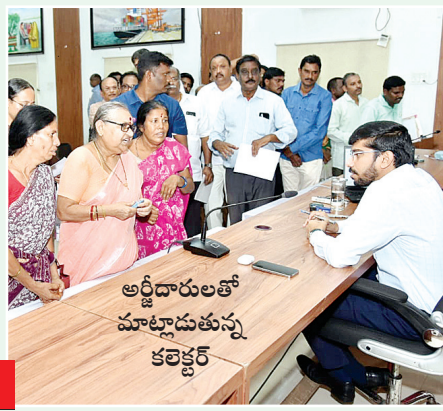
అర్జీదారులతో మాట్లాడుతున్న కలెక్టర్