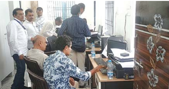
రికార్డుల పరిశీలిస్తున్న అధికారులు

విషయాలు క్షేత్రస్థాయిలో తెలుసుకున్నారు. స్థానిక సర్పంచ్ తోపాటు వార్డు సభ్యులు కూడా ఉన్నారు. రికార్డుల పరిశీలన ప్రక్రియ మండల వ్యాప్తంగా చర్చనీయాంశంగా మారింది. రెండు రోజుల్లో ప్రక్రియ పూర్తవుతుందని అధికారుల బృందం తెలిపింది.