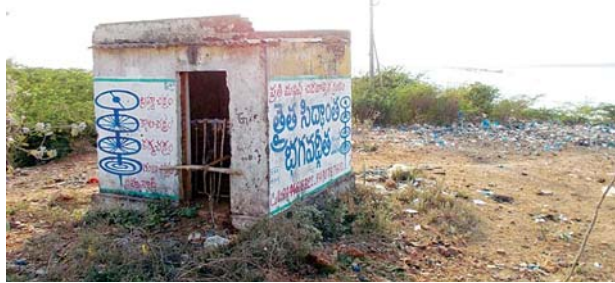
శిథిలమైన దోబీఘాట్ మోటర్ షెడ్ దృశ్యం