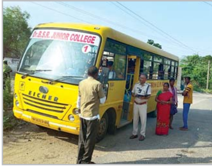
వాహనాల రికార్డులు పరిశీలిస్తున్న ఎంపీపి రాములు