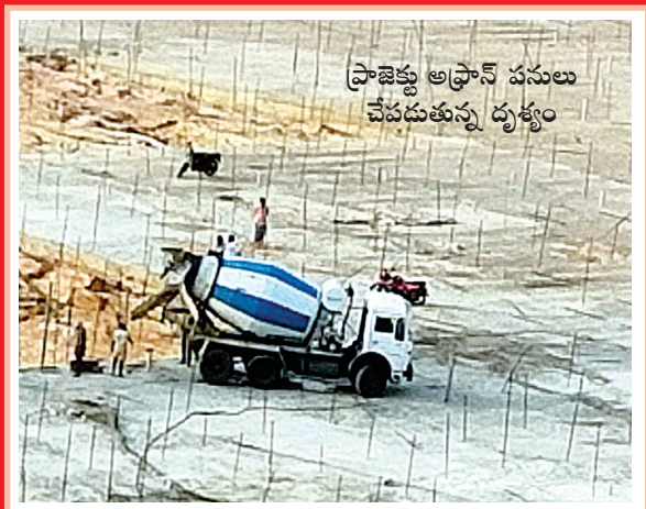
ప్రాజెక్టు ఆఫ్రాన్ పనులు చేపడుతున్న దృశ్యం

అంతసాగరం, మేజర్స్ న్యూస్ : సోమశిల ప్రాజెక్టు వద్ద ఆఫ్రాన్ పునర్నిర్మాణ పనులు ప్రారంభమయ్యాయి. జలాశయ రేడియల్ గేట్ల ముంగిట ఉన్న ప్రాంతంలో కాంక్రీట్ పనులు చేపట్టారు. దెబ్బతిని ఉన్న ప్రాంతంలో రాళ్లను వ్యర్థాలను తొలగిస్తూ పనులు చేపడుతున్నారు. ప్రస్తుతం ఇసుక కొరత ఉండడంతో బయట నుండి మిక్సింగ్ చేసుకొని భారీ యంత్రాల సహాయంతో పనులను చేపట్టారు. రాష్ట్ర మంత్రులు జలాశయాన్ని సందర్శించిన తరువాత నెల రోజులకు ఎట్టకేలకు పనులను చేపట్టడంపై సర్వతా హర్షం వ్యక్తం అవుతోంది. పనులను వేగవంతం చేసి త్వరితగతిన పూర్తి అయ్యేలా అధికారులు దృష్టి సారించారు. అయితే పనుల నిర్వహణపై, నాణ్యతపై పర్యవేక్షణ.. పరిశీలన సాగించాల్సిన అధికారులు ఆఫ్రాన్ ప్రాంతంలో కనిపించకపోవడం గమనార్హం.