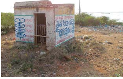
ఆత్మకూరు చెరువు పద్ద గతంలో నిర్మించిన దోబీఘాట్మోటర్ షెడ్ శిథిలమైన దృశ్యం