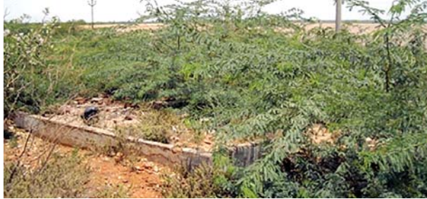
శిథిలమైన దోబీ ఘాట్..

అత్యుక్తారు, మేజర్స్ న్యూస్ : అత్యుక్తారు పట్టణానికి సంబంధించి దోబీఘాట్లు లేనందున రజకులు తీవ్రంగా ఇబ్బందిపడుతున్నారు. ఈ సంవత్సరం తప్ప గత ఐదారేళ్లుగా వర్షాలు కురవక చెరువులో నీరు లేక వాగులు, వంకలు కూడా ఎండిపోవడం తో వారి అవస్థలు వర్షనాటికే అంటుంటుంది. దూరంగా ఉన్న బగ్గేరు ఎంతో ప్రయాణంతో వెళ్లి అక్కడ మడుగుల్లో కొద్దిపాటి నీరుండడంతో పట్టణంలోని రజకులంతా వెళ్లి అక్కడ ఉతకడం ఇబ్బందిగా ఉండేది. కొందరైతే ఇక్కడనే ఇబ్బంది దివడుతూ దుస్తులు ఉతుకునేవారు. ఈ దశా పుష్కలంగా