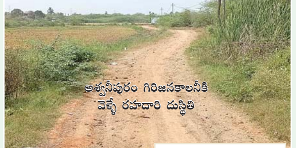
అశ్వనీపురం గిరిజనకాలనీకి వెళ్ళే రహదారి దుస్థితి