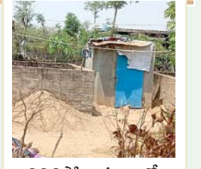
నిలిచిపోయిన ఇంట్లో మరుగుదొడ్డి