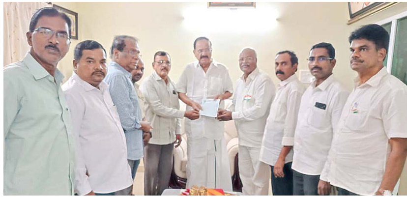
వెంకటాచలం, మేజర్ న్యూస్ : వెంకటాచలం, అసోసియేషన్ (డి పీఎంపీ అసోసియేషన్) ఆధ్వర్యంలో క్యాన్సర్ కారణాలు, పర్యావరణ కాలుష్యంపై అవగాహన కరపత్రాలను మాజీ ఉప