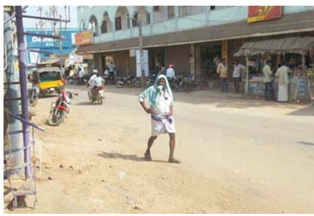
ఎండవేడిమికి ఇబ్బందిపడుతున్న వృద్ధుడు

వడదెబ్బకుగురైన వ్యక్తిని త్వరగా నీడుదే ప్రదేశానికి తరలించాలని, చల్లనినీటిలో ముంచిన గుడ్డతో శరీరం అంతా తుడవాలని, శరీర ఉష్ణోగ్రత సాధారణ స్థాయికి వచ్చేంతవరకు అలాగే చేయాలని, ఫ్యాసుగాలి, చల్లనిగాలి తగిలేలా చూడాలని, ఉప్పుకలిపిన మజ్జిగ లేదా చిటికెడు ఉప్పు కలిగిన గ్లూకోజ్ ద్రావణం లేదా ఓఆర్ఎస్ ద్రావణాన్ని త్రాగించాలని సూచిస్తున్నారు. పిల్లలు, గర్భిణీలు, వయోవృద్ధులు ఎండల్లో మరింత జాగ్రత్తలు పాటించాలని, వడదెబ్బకుగురైన రోగికి నీరుతాగించరాదని, వీలయినంత త్వరగా సమీపంలోని హాస్పిటల్ కు తరలించాలని కూడా ప్రజలకు అవగాహన కల్పిస్తున్నారు. ఏదేమైనా ఎండల తీవ్రత దృష్ట్యా అందరూ అత్యంత జాగ్రత్తలు పాటించాల్సిన అవసరం ఎంతైనా ఉంది.