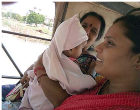
ఎండవేడిమికి ఆటోల్లో చిన్నారుల అవస్థలు

ఆత్మకూరు, మేజర్ న్యూస్ : ఆత్మకూరు పట్టణంలో, ఈ ప్రాంతంలో వేసవి ఆరంభం నాటినుండే ఎండలు కూడా తీవ్రంగా ఉన్నాయి. రోహిణి కారై కొనసాగుతూ ఆగస్టునెల చివరకు వచ్చినా ఎండలు అధికంగా ఉంటూ భానుడి భగభగలకు జనాలు తీవ్రంగా ఇబ్బందిపడుతూ ఆందోళనకు గురవుతున్నారు. మార్చి, ఏప్రిల్ నుండి ఎండలు ఆరంభమయినా మే నెల ప్రారంభం నుండి మరింతగా తీవ్రమయ్యాయి. ఆగస్టులో కూడా మేనెలను తలపించేవిధంగా ఎండలు కాస్తున్నాయి. ఉదయం 9 గంటలనుండే వడగాడ్పులు ఆరంభమవుతూ మధ్యాహ్నానికి మరింత తీవ్రమవుతున్నాయి. ఇటీవల రెండు రోజులపాటి 35 నుండి 37 డిగ్రీల ఉష్ణోగ్రత నమోదైంది. ప్రతిరోజూ 32 నుండి 35 డిగ్రీల ఉష్ణోగ్రత కాగా వడగాడ్పులు తీవ్రంగా ఉంటున్నాయి. ఉదయం 10 గంటలోగానే అందరూ ఇళ్ళకు చేరాల్సి ఉంది. అయినా ఇళ్ళలో కూడా సెగలుపోగలుగా ఉంటోంది. కాగా అవసరమైన వారు ఎండల్లో గొడుగులు, చిన్నారుల తలకు ప్రత్యేక దుస్తులు ఏర్పాటు చేసుకుంటూ వెళుతుండగా అనేకమంది మందువేసవి రోజుల్లోలాగా వడదెబ్బకు గురవుతామోనన్న ఆందోళనలో ఉన్నారు.