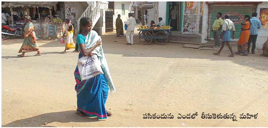
పసికందును ఎండలో తీసుకెళుతున్న మహిళ

ఎండల తీవ్రత, వడగాడ్పులు, వడదెబ్బల దృష్ట్యా ప్రజలు మరింతగా జాగ్రత్తలు పాటించాల్సిన అవసరం ఎంతైనా ఉంది. శరీరంకు చెమటపట్టక పోవడం, శరీర ఉష్ణోగ్రత పెరగడం, పలుకుపుట్టడం, మగతనిద్రలేక, కలవరింతలు, ఫిట్స్, పాక్షిక అనస్మారకస్థితి తదితర వడదెబ్బ లక్షణాలుంటాయని ఇండియన్ రెడ్ క్రాస్ సొసైటీ వారు ప్రత్యేక కరపత్రాల ద్వారా ప్రజలకు అవగాహన కల్పిస్తున్నారు. ఈ తీవ్ర ఎండల సమయంలో ఎక్కువగా బయట ఎండల్లో తిరగరాదని, రోడ్లవెంట విక్రయించే చల్లని రంగు పానీయాలు