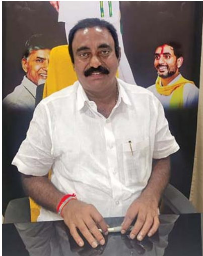
చంద్రబాబు ఉన్న సమయంలో శంకుస్థాపన చేశారని గుర్తు చేశారు. కావలి అభివృద్ధికి అన్ని రకాలుగా కృషి చేస్తానని తెలిపారు.

చంద్రబాబు నాయుడు నేరుగా ప్రారంభించాల్సి ఉందని కానీ, రాష్ట్ర, కేంద్ర ప్రభుత్వాలు సంయుక్తంగా హార్బర్ నిర్మించడంతో ప్రధాని మోడీ వర్చువల్గా ప్రారంభించడం జరుగుతుందన్నారు. ముఖ్యమంత్రి చంద్రబాబుని బుధవారం కలిసి హార్బర్కు రావలసినదిగా ఆహ్వానించడం జరిగిందని, త్వరలో హార్బర్కి వచ్చి పరిశీలిస్తామని చంద్రబాబు చెప్పడం జరిగిందని తెలిపారు. శాస్త్రీయ సాంకేతికతో హార్బర్ నిర్మాణం జరిగిందని తెలిపారు. ఎన్నో విజ్ఞ మత్స్యకారుల కల నెరవేరనుందని, హార్బర్ వల్ల మత్స్యకారుల జీవితాల్లో వెలుగులు పన్నాయని తెలిపారు. 2018లో ముఖ్యమంత్రిగా