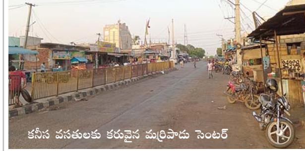
కనీస వసతులకు కరువైన మర్రిపాడు సెంటర్