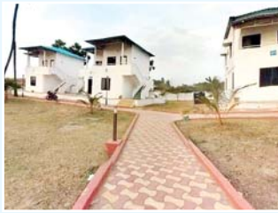
తుమ్మలపెంట తీరంలో సముద్రపు ఒడ్డున ఏపీ టూరిజం శాఖ నిర్మించిన హరిత బీచ్ రిసార్ట్ సందర్శకులకు ఆహ్లాదం కలిగిస్తున్నాయి. తీరప్రాంతంలో ప్రకృతి సముద్రం ఉండటంతో ఆ పర్యాటక కేంద్రానికి వారంతాలలో, సెలవు దినాలలో ఎక్కువగా పర్యాటకులు వస్తారు. పన్నెండు ఏపీ గదులు, ఒక రెస్టారెంట్ పర్యాటకుల కోసం ఉన్నాయి. పర్యాటక కేంద్రంలో పిల్లల కోసం ఊయల, జారుడుబల్ల, ఆట వస్తువులు ఏర్పాటు చేశారు.

కనువిందు చేస్తాయి. ఈ పురాతనమైన రేవుపట్నం సహజమైంది.. పరిశుభ్రమైన వాతావరణంతో ఉంటుంది. విశాలమైన ఇసుక తిన్నెలతో, పచ్చటి కొబ్బరి చెట్లతో ఆహ్లాదకరంగా ఉంటుంది. రణగణ ధ్వనులతో కూడిన పట్టణ జీవితం నుండి ప్రశాంతంగా గడవటానికి అనుకూలమైన ప్రదేశం. బీచ్ కి వెళ్లే దారిలో ఉన్న కృష్ణపట్నం లైట్ హౌస్ పర్యాటకులను ఆకట్టుకుంటుంది. ఈ లైట్ హౌస్ పైనుంచి కృష్ణపట్నం పోర్టు, పరిసర ప్రాంతాలను చూడవచ్చు. కృష్ణపట్నం పోర్టులో పర్యటించేందుకు, లైట్ హౌస్ ఎక్కేందుకు ముందుగా అనుమతి తీసుకోవాల్సి ఉంటుంది. కొత్త కోడూరు బీచ్ కు సముద్రంలో బోట్ షికారు ఒక మధురమైన అనుభూతి. ఇక్కడున్న చిన్న చిన్న పలహారశాలలో చేపలతో చేసిన రుచికరమైన వంటకాలు రుచి చూడవచ్చు. సముద్రతీరంలోనే ప్రసిద్ధి చెందిన వేళంగిని మాత చర్చి కలదు.