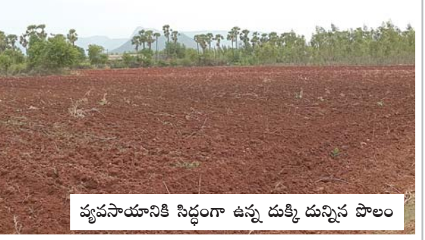
వ్యవసాయానికి సిద్ధంగా ఉన్న దుక్కి దున్నిన పొలం

చుక్క నీరులేని కదిరినేనిపల్లి చెరువు భారీగా వర్షం వచ్చేలా మేఘావృతం అవుతుంది. కానీ పట పట నాలుగు చినుకులు రాలిపోవడం జరుగు తుంది. ప్రధానంగా ఈ మండలాల్లో పత్తి మిరప వరి తదితర పంటలు ప్రస్తుతం సాగులో ఉన్నప్పటికీ వాటికి సాగునీరు అందించలేక రైతులు నానా తంటాలు పడుతున్నారు. గత వారం రోజులూగా ఎండ తీవ్రత విపరీతంగా ఉన్నందున పంటలకు బెట్ట సోకి నిలువునా ఎండిపోవడం ప్రారంభమైంది. ఏది ఏమైనప్పటికీ రాబోయే అది కొద్ది రోజుల్లో వర్షపాతం నమోదు కాకపోతే ప్రస్తుత ఏడాది వ్యవసాయం చేయడం గగనమేనని రైతులు అభిప్రాయం వ్యక్తం చేస్తున్నారు. ఇప్పటికే వ్యవసాయ పొలాలను దుక్కులు దున్ని పంటలు సాగు చేసేందుకు సిద్ధంగా ఉంచారు. ఇక వరుణుడి రాక కోసం ఆకాశం వైపు ఎదురుచూస్తూ ఉన్నారు.