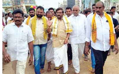
అండదండలతో ఎమ్మెల్యేగా భారీ మెజార్డితో విజయం సాధించానన్నారు. నామినేషన్ దాఖలు సమయంలో స్వామిని దర్శించుకుని ఆశీస్సులు అందుకున్నానని, శ్రీవారి ఆశీస్సులు ప్రజలందరికీ ఉండాలని మనస్ఫూర్తిగా కోరుకున్నారు.