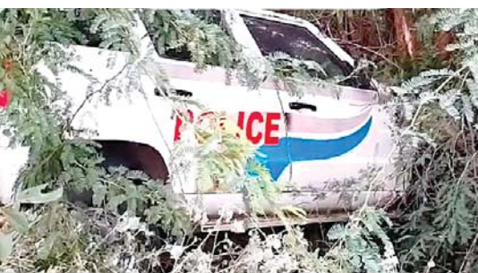
గురయ్యారు. ఈ క్రమంలో నిందితుడు అతివేగంగా టోల్ప్లాజా ను ఢీ కొట్టి గూడూరు వైపు వెళ్లిపోయాడు. అప్రమత్తమైన పోలీసులు నిందితుడు వాహనానికి సంబంధించిన సమాచారం అన్ని పోలీస్ స్టేషన్లకు అందివ్వడంతో పోలీసులు నిందితుల కోసం గాలింపు చర్యలు చేపట్టారు. ఈ క్రమంలో నిందితుడు మనుబోలు సమీపంలోని కాగితాలు పూర్ రోడ్డు మీదుగా పొదలకూరు, సంఘం, ఆత్మకూరు మీదుగా