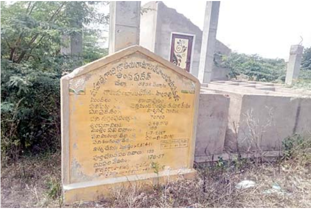
కొండాపురం, మేజర్స్వూస్ : గ్రామం శుభ్రంగా ఉండడంతోపాటు గ్రామ పంచాయితీలకు అదనపు ఆదాయం అందాలనే లక్ష్యంతో చెత్త నుండి సంపద

ద తయారీ కేంద్రాలు ఏర్పాటు చేశారు. గ్రామంలోని ఇండ్ల నుండి సేకరించిన తడి, పొడి వ్యర్థాలతో ఎరువు తయారు చేయడం, ఆ ఎరువులు రైతులకు విక్రయించడం. జరగాలి. అయితే మండలంలోని పార్లపల్లి, భీమవరప్పాడు గ్రామాలలో ఉన్న చెత్త నుండి సంపద తయారీ కేంద్రాలు అధికారుల ఉదాహరణతో లక్ష్యం నెరవేరడం లేదు. 2017లో రూ.3.48 లక్షల అంచనా విలువతో మహాత్మా గాంధీ జాతీయ ఉపాధి గ్రామీణ హామీ పథకంలో భాగంగా పార్లపల్లి గ్రామంలో చెత్త నుండి సంపద తయారీ కేంద్రం పనులను ప్రారంభించారు. 199 పనిదినాలలో 2018లో ఈ పనిని ముగించారు. కొన్నాళ్లపాటు నిర్వహణ సజావుగా సాగింది. తుఫాను సమయంలో ఈదురు గాలులకు తయారీ కేంద్రంపై వేసిన కొన్ని రేకులు ఎగిరిపోయాయి. అధికారులు పట్టించుకోకపోవడంతో మిగిలి ఉన్న రేకులు ఒక్కొక్కటిగా కనుమరుగయ్యాయి. సంపద తయారీ నిలిచిపోయింది. ప్రస్తుతం స్తంభాలు మాత్రమే దర్భనమిస్తున్నాయి. పరిసర ప్రాంతాలన్నీ కంప చెట్లతో కనిపిస్తున్నాయి. ఇప్పటికైనా అధికారులు స్పందించి సంపద తయారీ కేంద్రాన్ని ఉపయోగంలోకి తీసుకురావాలని గ్రామస్తులు కోరుతున్నారు.