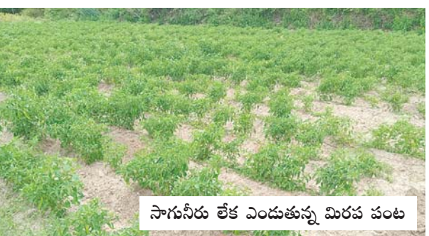
సాగునీరు లేక ఎండుతున్న మిరప పంట

నైరుతి రుతుపవనాల రాకతో ఖరీఫ్ సీజన్ ప్రారంభమవుతుంది. వర్షాలు సమృద్ధిగా కురుస్తాయి. అన్నదాతలు వ్యవసాయ పనులు పై దృష్టి పెడతారు. ఈ ఏడాది నైరుతి త్వరగా ప్రవేశించినప్పటికీ ఆశించిన స్థాయిలోవర్షాలు పడలేదు. ప్రారంభంలో అదపాదడపా కురిసి అన్నదాతల్లో ఆశలు రేకెత్తించాయి. రైతులు పొలం పనులకు సిద్ధమయ్యారు. ఈ రెండు నియోజకవర్గాల్లో అక్కడక్కడ వేరుశనగ విత్తనాలు