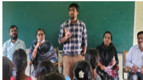
బిక్కూపూర్, ఆగస్టు 23, సూర్య మేజర్ న్యూస్