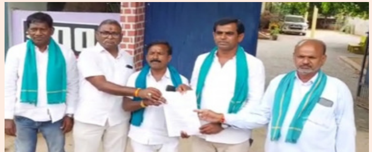
ఆర్మూర్ ప్రతినిధి, ఆగస్టు 23 సూర్య మేజర్ న్యూస్.