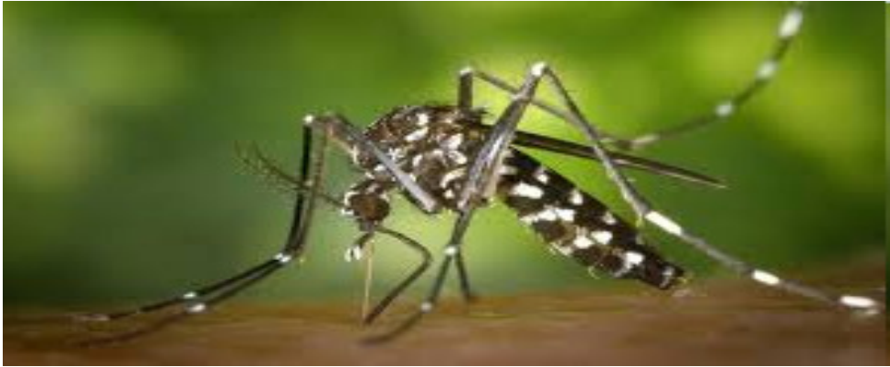
కామారెడ్డి, సూర్య మేజర్ న్యూస్, ఆగస్టు 23