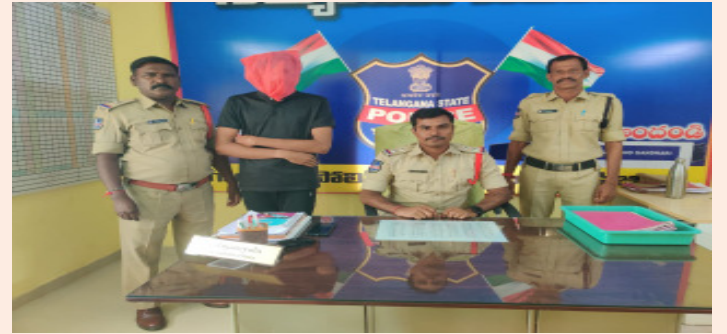
గాంధారి, సూర్య మేజర్ న్యూస్, ఆగస్టు 23