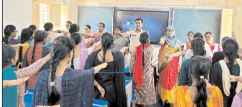
అనంతరం ఎస్ఐ కెజిబివి సిబ్బంది విద్యార్థినులచే డ్రగ్స్ రహితంగా ఉంటామని డ్రగ్స్ రహిత సమాజం లక్ష్యంగా పనిచేసి మాదకద్రవ్యాలను నిర్మూలించి దేశాభివృద్ధికి తమవంతు కృషిచేస్తామని ప్రతిజ్ఞ చేశారు.