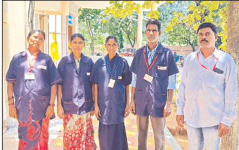
అధికారులు స్పందించి తమ జీతాలు వచ్చేలా చర్యలు తీసుకోవాలని శానిటరీ వర్కర్లు డిమాండ్ చేస్తున్నారు.

కంభం, మేజర్ న్యూస్: పట్టణంలోని స్థానిక ప్రభుత్వాసుపత్రిలో విధులు నిర్వహిస్తున్న శానిటరీ వర్కర్లకు గత ఆరు నెలలుగా తమ జీతాలు చెల్లించలేదని ఆవేదన వ్యక్తం చేస్తున్నారు.