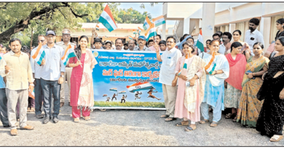
సహకార సంఘాల సిబ్బంది ఈ కార్యక్రమంలో పాల్గొని ర్యాలీని విజయవంతం చేశారు.