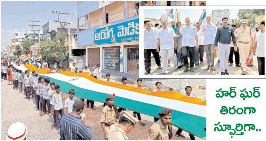
హర్ ఘర్ తిరంగా స్ఫూర్తిగా..