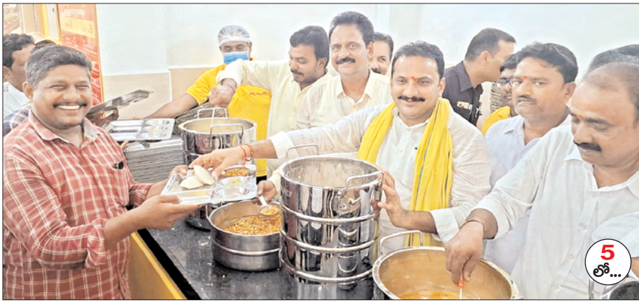
కందుకూరులో అన్న క్యాంటీన్ ప్రారంభోత్సవం అనంతరం అన్నం వడ్డిస్తున్న ఎమ్మెల్యే ఇంటూరి