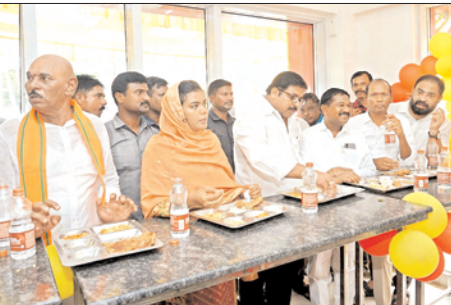
పెట్టారన్నారు. ఆయన స్పూర్తితోనే అనంతరం నారా చంద్రబాబు నాయుడు నేతృత్వంలోని ప్రభుత్వం అన్న క్యాంటీన్లను ప్రారంభించింది. వై.ఎస్.ఆర్.కాంగ్రెస్ ప్రభుత్వం వీటిని కొనసాగించలేదని, ప్రస్తుతం తమ కూటమి ప్రభుత్వం ఈ భవనాలను ఆధునికీకరించి

పునఃప్రారంభించింది. రూ 5లకే ఉదయం అల్పాహారం, రూ.5లకే మధ్యాహ్నం భోజనం, రూ.5లకే రాత్రి భోజనం మంచి నాణ్యతతో అందిస్తున్నామన్నారు. గతంలో పనిచేస్తున్న క్యాంటీన్లను ఈ నెలఖరులోపు పునఃప్రారంభిస్తామన్నారు. గతంలో మంజూరి నిర్మాణ దశలో ఆగిపోయిన కాంటీన్లను ఈ సంవత్సరంలోనే పూర్తిచేసి ప్రారంభించేలా చర్యలు తీసుకుంటామన్నారు. వీటిని సెల్ఫ్ ఫైనాన్సింగ్ నిర్వహించేలా ప్రభుత్వం ఆలోచిస్తున్నట్లు చెప్పారు. ప్రతి మండలంలోనూ అన్న క్యాంటీన్లను పెట్టే ఆలోచనతో ప్రభుత్వం ఉన్నట్లు మంత్రి తెలిపారు. ఒంగోలు శాసనసభ్యులు మాట్లాడుతూ నగరంలోని పేదలతో పాటు వివిధ పనుల నిమిత్తం పరిసర గ్రామాల నుంచి ఒంగోలుకు వచ్చే కూలీలకు ఉపయోగకరంగా ఉండేలా వీటిని నిర్వహిస్తున్నామన్నారు. పేదల ఆకలి తీర్చే