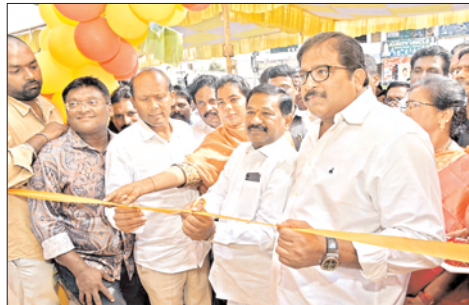
భుజించారు. ఈ సందర్భంగా మంత్రి మాట్లాడుతూ పేదల ఆకలితో బాధపడకూడదన్న సంకల్పంతోనే తెలుగుదేశం పార్టీ వ్యవస్థాపకులు, మాజీ ముఖ్యమంత్రి స్వర్ణీయ నందమూరి తారకరామారావు రెండు రూపాయలకే కిలో రేషన్ బియ్యం పథకాన్ని ప్రవేశ