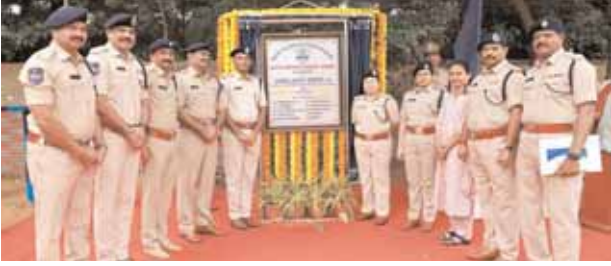
గండిపేట్, మేజర్ న్యూస్ (ఆగస్టు 08): పోలీసు శిక్షణలో మహిళలకు బ్యాటిల్