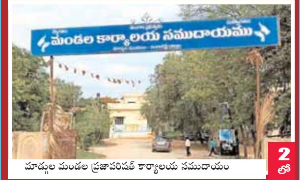
మాడ్చల మండల ప్రజాపరిషత్ కార్యాలయ సముదాయం