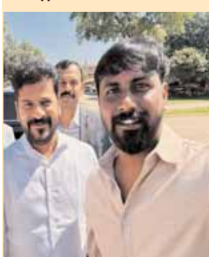
డల్లాస్ లో సీఎం రేవంత్ రెడ్డితో ఏర్పాటు కలవడం సంతోషంగా ఉందని తెలిపారు.