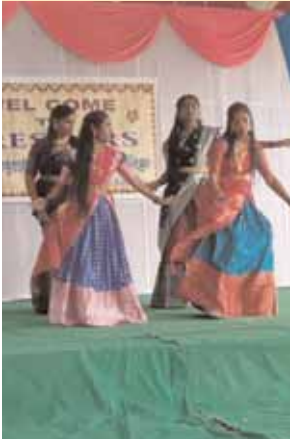
డాన్స్ చేస్తున్న విద్యార్థులు.