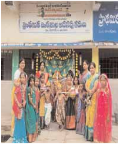
చెంగోల్ ప్రభుత్వ పాఠశాలలో

● ప్రభుత్వ పాఠశాలలో ఘనంగా శ్రీకృష్ణ జన్మాష్టమి వేడుకలు