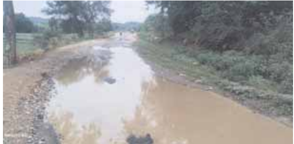
రోడ్డుపై నిలిచిన ఏరు

నుండి పగడిపల్లి గ్రామం మీదుగా కొడంగల్ నియోజకవర్గం నాగారం రుద్రారం, అన్నారం, కంకర రోడ్డు మాత్రం గాంధీ జాతీయ గ్రామీణ సడక్ యోజన పథకం ద్వారా 2020 సంవత్సరంలో రు. 2.68 కోట్లతో చెన్నారం,అక్కంపల్లి, పగడిపల్లి,నాగారం రుద్రారం అన్నారం. గ్రామాలకు దాదాపు 5 కిలోమీటర్లు మేర రహదారికి సదరు కాంట్రాక్టర్ దక్కించుకున్నాడు రోడ్డుకు కాల్కలు పూర్తి చేశారు. కంకర పరిచి బీటీ రోడ్డు వేయకపోవడంతో అడుగు అడుగునా మోకాళ్ళలోతు గుంతలు ఏర్పడి ఆటోలు ద్వీచక్ర వాహనాలు ప్రజలు తీవ్ర ఇబ్బందులు ఎదుర్కొంటున్నారు. కొడంగల్ నియోజకవర్గనికి చెందిన వివిధ గ్రామాలకు చెందిన ప్రజలు నిత్యం తాండూరు పట్టణానికి వ్యాపారం నిమిత్తం కోసం బిజినెస్ కోసం ప్రతిరోజు వంద సంఖ్యలో తాండూరుకు వస్తుంటారు సీఎం సొంత నియోజకవర్గంలోని గ్రామాల నాగారం, అన్నారం, రుద్రారం నుండి తాండూర్ నియోజకవర్గంలోని నీళ్లపల్లి,మైలవూర్ మీదనుండి కర్ణాటక ముదేలి, సేదం, గుర్తిటూకల్ లింకు రోడ్ ద్వారా వెళ్లవచ్చు బీటీ రోడ్డు లేకపోవడంతో నాన్న అవస్థలు పడుతున్న వివిధ గ్రామాల ప్రజలు నిధులు ఉన్నా కూడా కాంట్రాక్టర్ నిర్లక్ష్యంతో నిత్యం రోడ్డు ప్రమాదం జరిగిన వివిధ అధికారులు స్పందించకపోవడం విస్తారం, 2020 సంవత్సరంలో ప్రధానమంత్రి గ్రామీణ సడక్ యోజన ద్వారా ప్రారంభించిన నాలుగు సంవత్సరాలు దాటుతున్న రోడ్డు పూర్తి చేయించడంలో పంచాయతీరాజ్ అధికారులు కాంట్రాక్టర్ నిర్లక్ష్యంగా వ్యవహరిస్తున్నారన్న విమర్శలు వస్తున్నాయి.