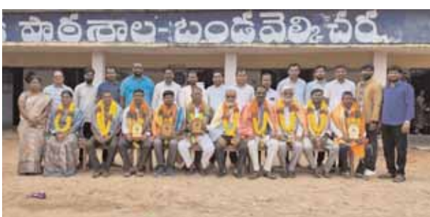
బదిలీపై వెళ్తున్న ఉపాధ్యాయులను సన్మానిస్తున్న దృశ్యం.