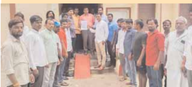
వినతి పత్రం అందజేస్తున్న దృశ్యం