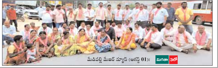
మేడిపల్లి మేజర్ న్యూస్ (ఆగస్టు 01): మిగతా 3లో