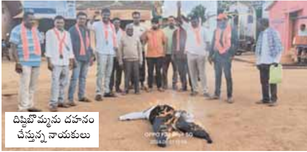
దిప్టిబొమ్మను దహనం చేస్తున్న నాయకులు