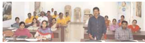
సమావేశంలో పాల్గొన్న వివిధ విభాగాల అధికారులు

అధికారులు అందరు అవగాహనా కార్యక్రమాలలో పాల్గొని ఎవరైనా సమావేశాలను, బాలికలను ఇబ్బందులకు గురిచేస్తే తమ కోసం షీ అధికారులు ఉన్నారని ఎవరైనా లైంగిక వేధింపులకు గురి అయితే భరోసా అధికారులు ఉన్నారని విషయాన్ని జిల్లాలోని ప్రతి గ్రామ గ్రామా ప్రజలకు తెలియజేసే విధంగా అవగాహనా కల్పించాలన్నారు. ఎవరైనా ఏదైనా ఇబ్బందులకు గురి అయినా వెంటనే పోలీస్ అధికారులకు గాని, షీ టీం, భరోసా అధికారులకు గాని తెలియజేస్తే వారి వివరాలు కూడా గొప్పంగా ఉంచడం జరుగుతుందన్నారు. జిల్లాలో ఎవరైనా ఆడపిల్లల జోలికి వెళితే కఠినమైన చర్యలు తీసుకోవడం జరుగుతుందని, అదేవిధంగా ఎవరైనా విద్యార్థులు ర్యాగింగ్ లకు పాల్పడిన కఠినమైన చర్యలు తీసుకోవడం జరుగుతుందన్నారు. ఈ కార్యక్రమంలో జిల్లా అదనపు ఎస్పి రవీందర్ రెడ్డి, డిస్ట్రిక్ట్ సైబర్ క్రైం కో ఆర్డినేషన్ సెంటర్, డివిసిపి ప్రకాష్ రెడ్డి, షీ టీం, భరోసా మరియు కళాశాల బృందం అధికారులు తదితరులు పాల్గొన్నారు.