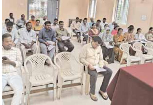
సమావేశంలో పాల్గొన్న అధికారులు.

సూచించారు. గ్రామాలలో ప్రజలకు పరిసరాల పైన అవగాహన కల్పించినప్పుడే డెంగ్యూ మలేరియా లాంటి వ్యాధులు సోకకుండా ప్రజలందరూ ఆరోగ్యంగా ఉంటారని సూచించారు. సమావేశాని రాని అధికారులపై చర్యలు తీసుకోవడం జరుగుతుందన్నారు. ఈ కార్యక్రమంలో మండల అభివృద్ధి అధికారి, మండల పంచాయతీ అధికారి, గ్రామ పంచాయతీ ప్రత్యేక అధికారులు, పంచాయతీ కార్యదర్శులు, సమస్త మండల స్థాయి అధికారులు పాల్గొన్నారు.