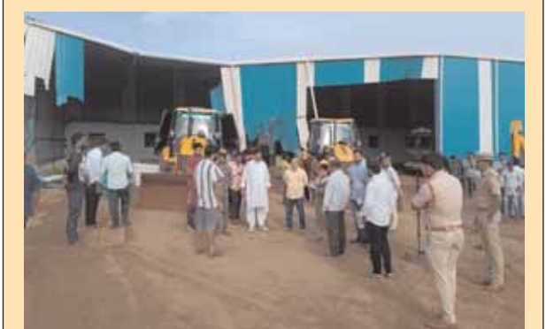
ప్రభుత్వ స్థలంలో ఏర్పాటు చేసిన రైసుమిల్లును కూల్చివేసిన అధికారులు