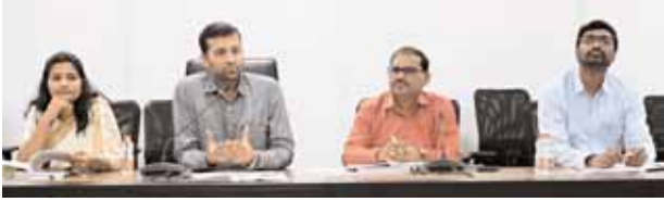
సమావేశంలో మాట్లాడుతున్న కలెక్టర్ ప్రతిక్ జైన్

వికారాబాద్ జిల్లా ప్రతినిధి, మేజర్ న్యూస్ (ఆగస్టు 03) అభివృద్ధి కార్యక్రమాలు చేపట్టేందుకు భూ సేకరణకు రైతులు సహకరించాలని జిల్లా కలెక్టర్ ప్రతిక్ జైన్ కోరారు. కొడంగల్ ప్రాంత అభివృద్ధి అథారిటీ కింద అభివృద్ధి పనులను చేపట్టేందుకు భూసేకరణ నిమిత్తం శనివారం కలెక్టరేట్ లోని సమావేశ మందిరంలో అప్పాయిపల్లి రైతులతో సమావేశాన్ని నిర్వహించి అభిప్రాయ