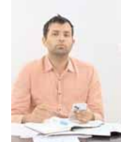
కలెక్టర్ ప్రతీక్ జైన్

వికారాబాద్ జిల్లా ప్రతినిధి, మేజర్ న్యూస్ (ఆగస్టు 07) : స్థానిక సమస్యలను పరిష్కరించే వినూత్న ఆవిష్కరణలకు అవకాశం ఇంటింటా ఇన్నోవేటర్ కల్చిస్తోందని, వినూత్న ఆవిష్కరణ దరఖాస్తు చేసుకోవడానికి ఈ నెల 10వ తేదీ వరకు పోడింగ్ చేసినట్లు జిల్లా కలెక్టర్ ప్రతీక్ జైన్ బుధవారం ఒక ప్రకటనలో తెలిపారు. ప్రత్యేక ఆవిష్కరణలను ప్రోత్సహించేందుకు రాష్ట్ర ప్రభుత్వం ఇంటింటా ఇన్నోవేటర్ కార్యక్రమం ఏర్పాటు చేసిందని, గృహిణి నుండి పాఠశాలలు, కళాశాల స్థాయి