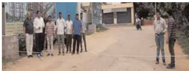
రోడ్డు కొలతలు తీస్తున్న దృశ్యం.

ఖండించారు. పోచారం మున్సిపాలిటీ పరిధి అన్వేషిస్తూనే ఐడియా ఎస్టేట్స్ సంస్థ కార్యాలయంలో బుధవారం విలేజ్ కలెక్షన్ సమావేశంలో పైన తెలిపిన