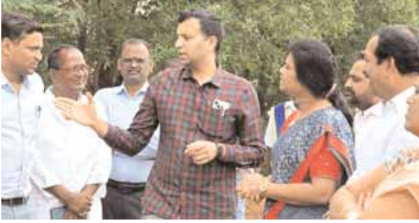
మాట్లాడుతున్న కలెక్టర్ ప్రతీక్ జైన్.

వికారాబాద్ జిల్లా ప్రతినగర, మేజర్ న్యూస్ (ఆగస్టు 07): మున్సిపల్ పరిధిలోని పార్కుల అభివృద్ధికి చర్యలు తీసుకోవాలని జిల్లా కలెక్టర్ ప్రతీక్ జైన్ అధికారులను ఆదేశించారు. బుధవారం స్వచ్ఛదనం - పచ్చదనం కార్యక్రమంలో భాగంగా వికారాబాద్ మున్సిపల్ పరిధిలోని 14వ వార్డు, 23వ వార్డులలో జిల్లా కలెక్టర్ పర్యటించారు. మున్సిపల్ లోని వివిధ వార్డుల్లోని పార్కులను