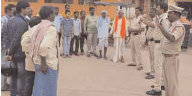
ప్రజలకు అవగాహన కల్పిస్తున్న పోలీసులు

దోమ, మేజర్ న్యూస్ (ఆగస్టు 07): దోమ మండల కేంద్రంలో ఆటో స్టాండ్ దగ్గర సైబర్ నేరాలపై, కొత్త చట్టాలపై అవగాహన కల్పించిన దోమ పోలీసులు. సైబర్