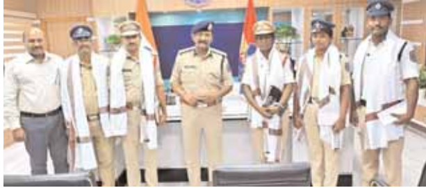
విద్యార్థులను రక్షించిన పోలీసులను సన్మానించిన కమిషనర్ మేధల్ జిల్లా ప్రతినిధి, మేజర్ న్యూస్(ఆగస్టు, 7): లిప్టులో ఇరుక్కున్న విద్యార్థులను

● లిప్టు డోర్లు తెరుచుకోక నలభై నిమిషాల పాటు ఇబ్బంది పడ్డ విద్యార్థులు