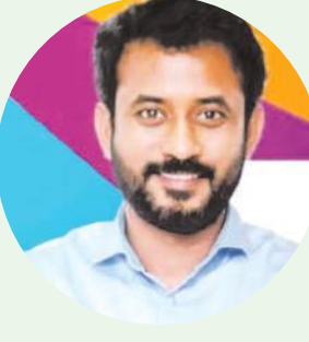
విశాఖపట్నం, ఆగస్టు 2, మేజర్స్: విశాఖ మాజీ ఎంపీ ఎంపీవీ సత్యనారాయణ,