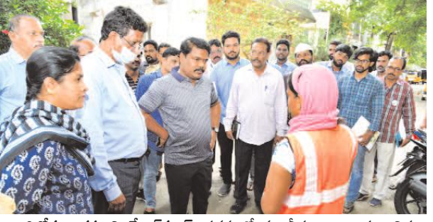
ఆదిల్, ఆగస్టు 2, మేజర్స్: సగంరో గల వీధులు, కాలనీలు నిత్యం పరిశుభ్రపరచాలని, రోడ్ల పై, కాలనీలలో వ్యర్థాలు లేకుండా చూడాలని జీవీఎంసీ కమిషనర్ పి. సంపత్ కుమార్ జీవీఎంసీ అధికారులను మిగతా 2లో