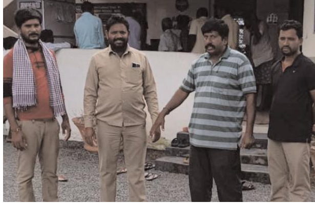
చేసిన హమాలీ యూనియన్ నాయకులను విడుదల చేయాలని,లేని పక్షంలో కార్మిక లోకం చూస్తూ ఊరుకోదని ఆయన పేర్కొన్నారు.