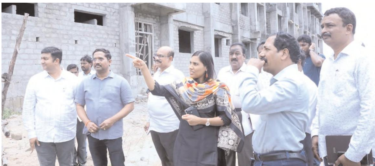
దరఖాస్తుదారులు వస్తే వెంటనే సరి చేసి పంపించాలని అన్నారు.అక్కడున్న రిజిస్టర్ ను తనిఖీ చేసి రోజుకు ఎంతమంది దరఖాస్తుదారులు వస్తున్నది అడిగి తెలుసుకున్నారు. ముఖ్యంగా గ్యాస్ సిలిండర్, గృహ జ్యోతి పథకం

ఆసుపత్రి నిర్మాణం 95 కోట్ల రూపాయలని తెలిపారు. అధికారులు, కాంట్రాక్టర్ సమన్వయంతో పనిచేసి ఆసుపత్రి త్వరగా అందుబాటులోకి వచ్చేటట్లు చర్యలు తీసుకోవాలని అన్నారు. అనంతరం పరకాల ఎంపీడివో కార్యాలయంలో ఏర్పాటు చేసిన ప్రజా పాలన కార్యక్రమంలో గృహజ్యోతి ,మహాలక్ష్మి పథకాల కొరకు ఇంత క్రితమే దరఖాస్తు చేసుకున్న దరఖాస్తుదారులు తమ దరఖాస్తుల్లో ఏమైనా తప్పులుంటే సరిచేసుకోవడానికి సేవా కేంద్రం ఏర్పాటు చేయడం జరిగింది. ఈ సేవా కేంద్రాన్ని జిల్లా కలెక్టర్ ప్రావిణ్య తనిఖీ చేసి అక్కడున్న అధికారులతో మాట్లాడుతూ ఎవరైనా