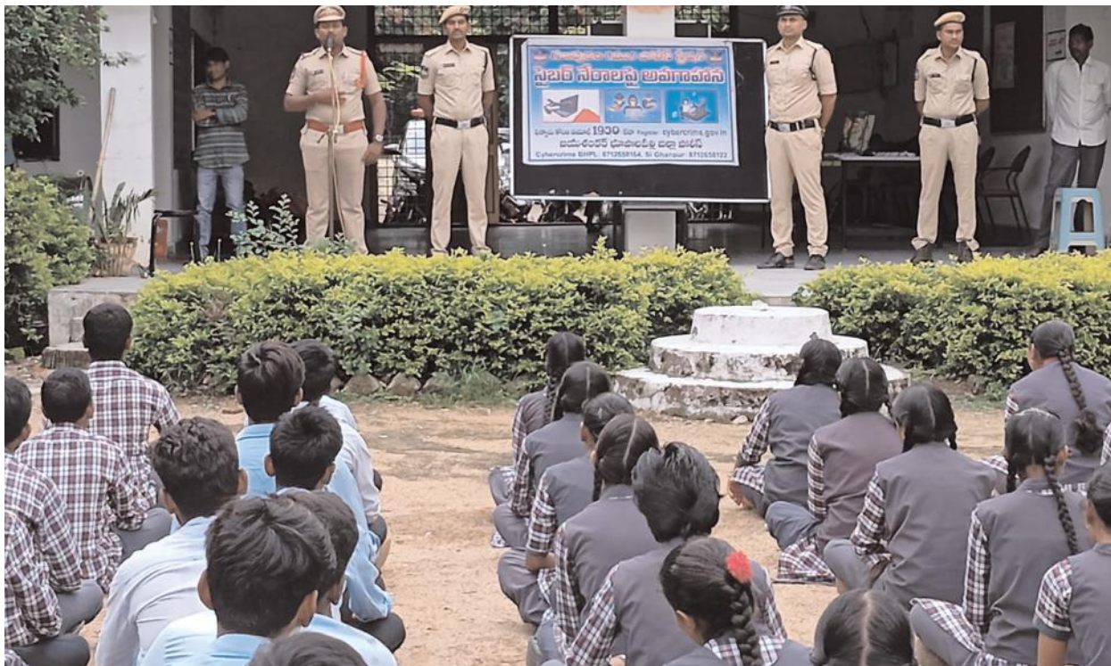
కలిగి ఉండాలని ఎవరైనా సైబర్ నేరాలకు గురైతే వెంటనే 1930 కు కాల్ చేయాలని అత్యవసర పరిస్థితులలో 100 కి లేదా గణపురం ఎస్ఐ 8712658122, స్టేషన్ 8712758143 నెంబర్ కి ఫోన్ చేసి సమస్యలను