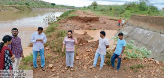
ఉధృతంగా ప్రవహిస్తున్న కిన్నెరసాని తీవ్రంగా నష్టపోయిన రైతులు

బూర్గంపాడు, సూర్య (మేజర్ న్యూస్)- గత రెండు రోజులుగా ఎడతెరపకుండా కురుస్తున్న వర్షంతో జనజీవనం అస్తవ్యస్తంగా మారింది. బూర్గంపాడు మండలంలోని అనేక ప్రాంతాల్లో వడలని వర్షంతో ప్రజలు నానా ఇబ్బందులు పడుతున్నారు. ఈ క్రమంలో బూర్గం పాడు మండలంలోని వాగులు, చెరువులు పొంగిపొర్లుతున్నాయి. ఇదే క్రమంలో కిన్నెరసాని వాగు ఉధృతంగా ప్రవహించడంతో లోతట్టు ప్రాంతాలైన ఉప్పుపాక, పినపాక పట్టి నగర్, సోంపల్లి, బూర్గంపాడులోని ముంపు ప్రాంతాలు లోతట్టు ప్రాంతాల్లోని పంట పోలాల జలమ యంగా మారాయి. అదేవిధంగా కురుస్తున్న వర్షాల వల్ల మండలంలోని చెరువులలోకి నీరు అధికంగా చేరడంతో చెరువులు పొంగిపొర్లుతున్నాయి. మండలంలోని దోమల వాగు చెరువు ఉధృతంగా ప్రవహించడంతో లోతట్టు ప్రాంతాల్లోని పొలాలూ నీట