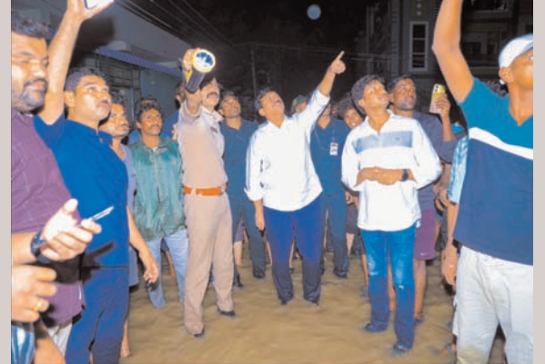
పరిస్థితిని దగ్గర ఉండి సమీక్షిస్తున్న మంత్రి పాంగులేటి