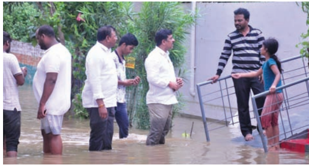
ఖమ్మం సూర్య (మేజర్ స్కూల్):