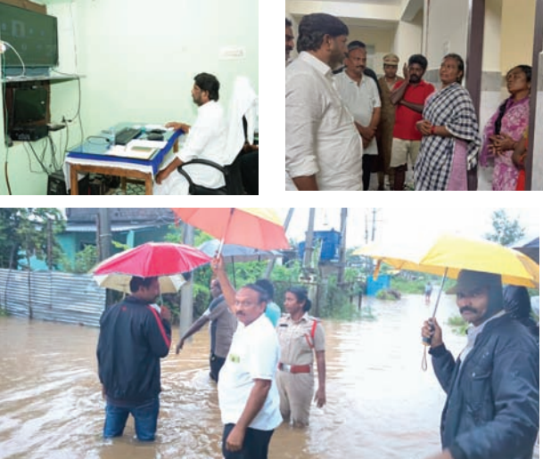
క్యాంపులకు తరలించాలని.. అక్కడ వారికి ఎలాంటి అసౌకర్యం కలగకుండా చూడాలన్నారు.

కలెక్టర్, సీపీఐ పరిస్థితిని సమీక్షించిన డిప్యూటీ సీఎం మంచురాలు జిల్లా చెన్నూరు వెళ్లవలసిన పర్యటనను అర్ధాంతరంగా వాయిదా వేసుకుని హుటాహుటిన ముద్దీర్కు పయనమైన డిప్యూటీ సీఎం భట్టి విక్రమార్క మార్గ మధ్యలోనే ఖమ్మం కలెక్టర్, ఖమ్మం పోలీస్ కమిషనర్, ఖమ్మం కార్పొరేషన్, ముద్దీర్ రెవెన్యూ, మున్సిపల్ అధికారులతో ఫోన్లో మాట్లాడి పరిస్థితిని సమీక్షించి వారికి పలు సూచనలు చేశారు. ఎడతెరిపి లేకుండా కురుస్తున్న వర్షాల నేపథ్యంలో ప్రజలు అప్రమత్తంగా ఉండాలని కోరారు. అధికారులు అలర్ట్ గా ఉండాలని ఆదేశించారు. వాగులు, వంకలు నదులు పొంగుతున్న నేపథ్యంలో ప్రజలకు ప్రత్యామ్నాయ రవాణా మార్గాలు ఏర్పాటు చేయాలని అధికారులను ఆదేశించారు. లోతట్టు ప్రాంతాల ప్రజలను