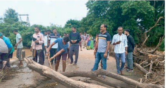
నీట మునిగిన పంట చేలు..దిక్కుతోచని స్థితిలో రైతులు గ్రామాలలో తెగిపోయిన కల్వర్టులు రాకపోకలకు ఇబ్బందులు ఉప్పొంగుతున్న వాగులు మునిగిపోయిన వంతెనలు

అక్కపల్లి, సూర్య (మేజర్ న్యూస్) - గత రెండు రోజులుగా కురుస్తున్న ఎడతెరిపిలేని భారీ వర్షాలకు మండల వ్యాప్తంగా ఉన్న వాగులు వంకలు చెరువులు నిండుకుండను తలపిస్తున్నాయి. జిల్లా కేంద్రం నుంచి అక్కపల్లి వచ్చే మార్గంలో కిన్నెరసాని నది, మార్వల వాగు, అనిశెట్టిపల్లి సమీపంలో ఉన్న పుణ్యపువాగు ఉద్యతంగా ప్రవహిస్తున్నాయి. వంతెనల పైనుండి సుమారు మూడు అడుగుల ఎత్తులో నీరు ప్రవహిస్తుండడంతో రాకపోకలు పూర్తిగా స్తంభించాయి. మండల వ్యాప్తంగా ఉన్న అనేక చెరువులు కుంటులు పూర్తిగా నిండి వరద ప్రవాహం ఇళ్లలోకి చేరి ప్రజలు నానా ఇబ్బందులు పడుతున్నారు. భారీ భారీ వరద ప్రవాహాలకు కొన్ని