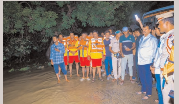
రెండు పడవల సహాయంతో బాధితులను రక్షిస్తున్న రెవెన్యూ టీం