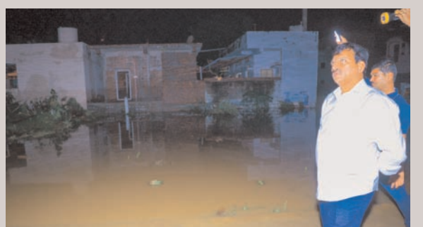
రాజీవ్ గృహకల్పలో కొనసాగుతున్న సహాయక చర్యలు

కవర్గంలోని మిగిలిన మండలాల్లోని గ్రామాల్లో నెలకొన్న పరిస్థితుల పై ఆరా తీస్తున్న పాంగులేటి ప్రజలకు కావాల్సిన అన్ని చర్యలు తీసుకోవాలని అధికారులకు సూచన.