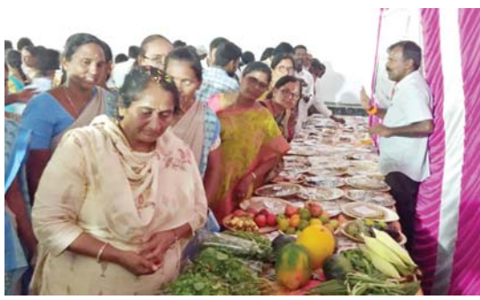
స్టాల్స్ ను పరిశీలిస్తున్న మంత్రి