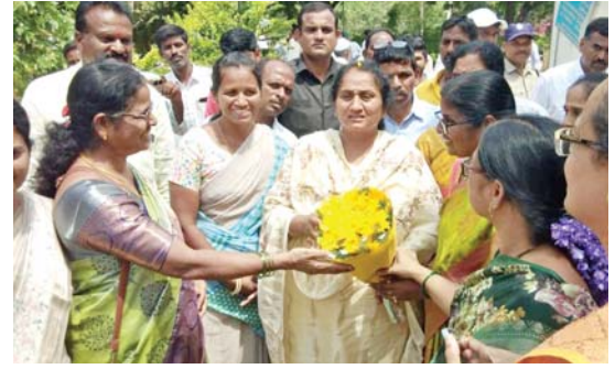
మంత్రిని సన్మానిస్తున్న సిబ్బంది