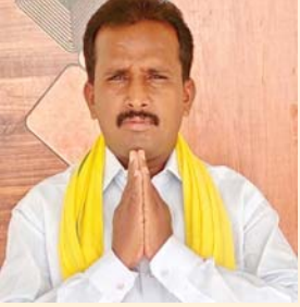
తప్పకుండా శాలివాహనుల అభివృద్ధికి సమన్వయంతో పనిచేస్తానని తెలిపారు. కుమ్రురులకు నామినేటెడ్ పదవుల్లోనూ ప్రాధాన్యత కల్పించాలని కోరారు.