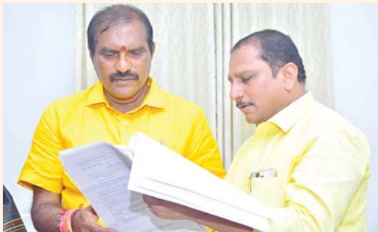
కాల్యల పునర్నిర్మాణం, సైట్ వాల్స్ నిర్మాణం పూర్తవుతుందని ఆయన మంత్రి దృష్టికి తీసుకెళ్లారు. ఇందుకు సంబంధించి వివరించారు కూడా అందజేశారు. ఎమ్మెల్యే దగ్గుపాటి విజ్ఞప్తికి మంత్రి రామానాయుడు సానుకూలంగా స్పందించారు. ఉన్నత స్థాయిలో దీనిపై చర్చించి నిధులు విడుదల చేస్తామని హామీ ఇచ్చారు.

అనంతపురం మేజర్ న్యూస్ : అనంతపురం అర్బన్ నియోజకవర్గ పరిధిలోని ప్రజలకు తీవ్ర ఇబ్బందికరంగా ఉన్న నడిమివంక, మరువవంకల పునర్నిర్మాణానికి.. నిధులు ఇవ్వాలని జలవనరుల శాఖ మంత్రి రామానాయుడుకు ఎమ్మెల్యే దగ్గుపాటి ప్రసాద్ విజ్ఞప్తి చేశారు. అనంతపురం జిల్లా పర్యటనలో భాగంగా ఆర్.అండ్.బి అతిథి గృహానికి వచ్చిన మంత్రి రామానాయుడును ఎమ్మెల్యే దగ్గుపాటి కలిశారు. భారీ వర్షాల సమయంలో నడిమి వంక, మరువవంకల వలన కలుగుతున్న ఇబ్బందులను మంత్రి రామానాయుడు దృష్టికి తీసుకెళ్లారు. ఎగువ ప్రాంతాల్లో భారీ వర్షాలు కురిస్తే నడిమివంక, మరువ వంక పరిధిలో ఉన్న కాలనీలో నీటి ముసుగుతున్నాయని.. దీని వలన వందలాది కుటుంబాలు సజీవంగా ఉన్నాయని ఆయన మంత్రి రామానాయుడు దృష్టికి తీసుకెళ్లారు. అందుకే ఈ కాల్యల పునర్మాణం చేపట్టాలని అధికారులు సూచించారు.. ఇప్పటికే ఎందుకు సంబంధించిన పరిపాలన అనుమతులు కూడా వచ్చాయని ఆయన వివరించారు. మొత్తం మూడు విభాగాలుగా ఈ కాల్యలపనులు చేపట్టాల్సి ఉందన్నారు. ఈ పునర్నిర్మాణానికి 124 కోట్లు అవుతుందని అంచనా వేశారని వివరించారు. ప్రభుత్వం స్పందించి ఈ నిధులు కేటాయస్తే