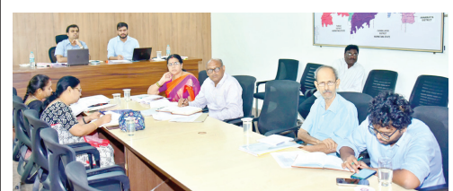
సమావేశంలో మాట్లాడుతున్న కలెక్టర్ టీఎస్ చేతన్