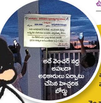
అదే వెంచర్ వద్ద అహదా అధికారులు ఏర్పాటు చేసిన హెచ్చరిక బోర్డు