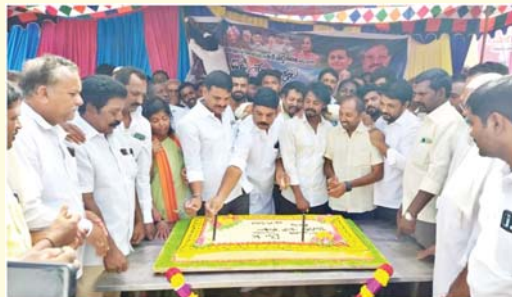
-కేక్ కటింగ్, అన్నదాన కార్యక్రమం