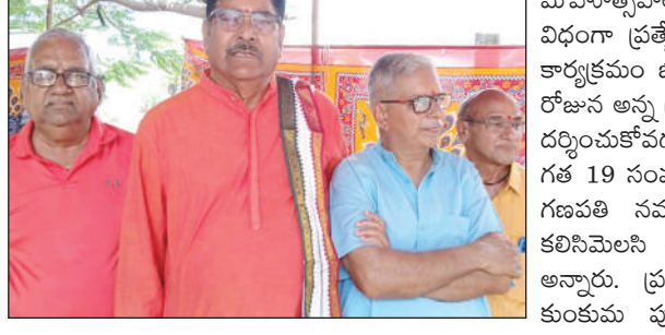
నిర్వహించాలని, అర్ధం పర్వం లేని పాటలు, అక్షీల నృత్యాలు, మధ్యపానాలకు వేదిక కాకూడదని అందిదరికి తెలియజేయమన్నామని అన్నారు. ఈ కార్యక్రమంలో శ్రీ పాద బావనార్యులు అలయ శ్రీబాల గంగాధర తిలక్ గణేష్ ఉత్సవ కమిటీ సభ్యులు, అధిక సంఖ్యలో భక్తులు పాల్గొన్నారు.