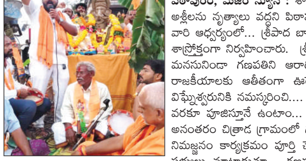
నిర్వహించాలని, అర్ధం పర్వం లేని పాటలు, అక్షీల నృత్యాలు, మధ్యపానాలకు వేదిక కాకూడదని అందిదరికి తెలియజేయమన్నామని అన్నారు. ఈ కార్యక్రమంలో శ్రీ పాద బావనార్యులు అలయ శ్రీబాల గంగాధర తిలక్ గణేష్ ఉత్సవ కమిటీ సభ్యులు, అధిక సంఖ్యలో భక్తులు పాల్గొన్నారు.

- అర్ధం పర్వం లేని పాటలు, అక్షీల నృత్యాలు వద్ద - హిరపురం శ్రీబాల గంగాధర తిలక్ గణేష్ ఉత్సవ కమిటీ