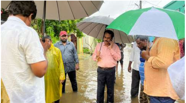
మంగళగిరి, మేజర్ న్యూస్: గత రెండు రోజుల కురుస్తున్న వర్షం కారణంగా శనివారం వరద ప్రవాహం మంగళగిరి జనజీవానని స్తంభించింది. కొండ ప్రాంతం నుండి వచ్చిన వరద నీరు ఒక్క సారి పెరగటంతో ఉదయం 9 గంటల నుండి సాయంత్రం 4 గంటల వరకు పట్టణ పుర వీధులు జలసాంద్రంగా మారాయి. గోతమ బుద్ధరోడ్డు, జాతీయ రహదారులపై వర్షపు నీరు రెండు ఆడుగుల