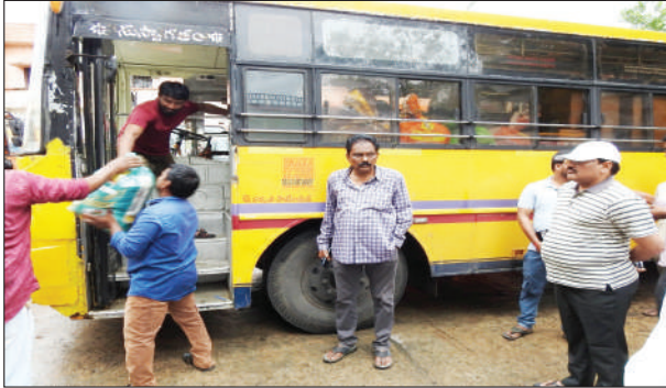
విజయవాడలోని పర్యవేక్షణ అధికారులు అందే వరకు జిఎసి నుండి ప్రత్యేక అధికారులను నియమించామని తెలిపారు.

గత 2 రోజులుగా కురుస్తున్న భారీ వర్షాలకు విజయవాడ నగరంలోని ముంపు ప్రభావిత ప్రజలకు గుంటూరు నగరపాలక సంస్థ తరుపున బిస్కెట్స్, పాలు, బ్రెడ్, ఫులిహార అందిస్తున్నామని గుంటూరు నగరపాలక సంస్థ కమిషనర్ పులి శ్రీనివాసులు సోమవారం తెలిపారు. ఈ సందర్భంగా కమిషనర్ మాట్లాడుతూ భారీ వర్షాల వలన విజయవాడ నగరంలోని అనేక ప్రాంతాల్లో ప్రజలు ముంపుకు గురై తీవ్ర ఇబ్బందులు పడుతున్నారని, వారికి రాష్ట్ర పురపాలక శాఖ మంత్రి నారాయణ , సంచాలకులు హరి నారాయణ మురగన్ ఆదేశాల మేరకు గుంటూరు నగరపాలక సంస్థ తరపున ఆదివారం పాలు, బిస్కెట్స్, వాటర్ బాటిల్స్, బ్రెడ్ ప్యాకెట్స్ అందించామని, సోమవారం కూడా ఘూమూరు 55వేలు ఫులిహార, 31,200 వేల వాటర్ బాటిల్స్, 52 వేలు బిస్కెట్ ప్యాకెట్స్, 23 వందల బ్రెడ్ ప్యాకెట్లు అందిస్తున్నామని తెలిపారు. ఆహారం, వాటర్ బాటిల్స్ లను విజయవాడకు ప్రత్యేక వాహనాల ద్వారా పంపిస్తున్నామని,