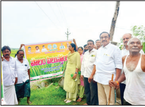
పెంచేందుకు సహకరించాలని, లాభసాటి వ్యవసాయానికి పాలం పిలుస్తుంది కార్యక్రమం