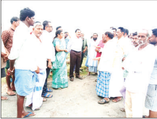
తెలియజేశారు. 90 రోజుల వయసు ఉన్న పొలంలో బూస్టర్ డోస్ గా 30 కిలోల యూరియా మరియు 10 కిలోల పొటాష్ ఒక ఎకరాకు వేసుకోవాలి అని గ్రామ రైతులు పాల్గొన్నారు.

పెదకూరపాడు మేజర్ స్టాన్ : పెదకూరపాడు మండలంలోని పాటిబండ్ల గ్రామంలో అధిక వర్షాలకు దెబ్బతిన్న పంట పొలాలను ఐ మురళి జిల్లా వ్యవసాయ అధికారి పరిశీలించారు. పంట నష్టం అంచనా జాబితాను పారదర్శకంగా సెప్టెంబర్ 10 లోపు పూర్తి చేయాలని సిబ్బందికి ఆదేశాలిచ్చారు. గ్రామ రైతులకు ప్రస్తుతం ప్రతి పంటలో తీసుకోవలసిన యాజమాన్య పద్ధతులు గురించి తెలియజేశారు. ప్రతి పొలంలో నిల్వ ఉన్న నీటిని బయటకు పంపించి 13- 0- 45 :10 గ్రాములు లేదా 19- 19-19: 10 గ్రాములు లేదా యూరియా 20 గ్రాములు మరియు 10 గ్రాముల మెగ్నీషియం సల్ఫేట్ ను లీటర్ నీటికి కలిపి పిచికారీ చేయాలని