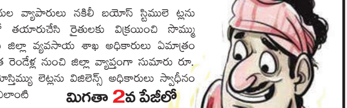
మిగతా 2వ పేజీలో

గుంటూరు జిల్లా వ్యవసాయ శాఖలో లంచావతారులు పెరిగిపోతున్నారు. ఎరువులు, పురుగుమందుల షాపులు, బయో కంపెనీల వద్ద పెద్ద ఎత్తున కాసులు గుంజి రైతులకు ద్రోహం చేస్తున్నారు. ఎరువులు బయో షాపుల యాజమాన్యాల వద్ద శాంపిల్స్ సేకరణలో ప్రతి శాంపిల్ కి రూ. 700 నుండి రూ. 1000 వసూలు చేస్తున్నారు. దీంతో వ్యాపారులు మట్టి అమ్మినా దానిని మంచి మందుగా చిత్రికరించి ల్యాబ్ పరీక్షల్లో ఫలితాలు ఇస్తున్న ఘనులు ఈ జిల్లాలోనే ఉన్నారు. నకిలీ పురుగు, బయో, బయోస్టిములేట్ లు ఎలాంటి అనుమతులు లేకుండా తయారు చేస్తున్న వ్యాపారులతో చేతులు కలిపి రైతులకు ద్రోహం చేస్తున్నారు. జిల్లా వ్యాప్తంగా ఈ తంతు కొనసాగుతున్నా అధికారులు చోద్యం చూస్తున్నారు. కలెక్టర్, ఉన్నతాధికారులకు తప్పుడు రిపోర్టులు పంపుతున్నారు. విజిలెన్స్ అధికారులకు ముందుగా సమాచారం ఇస్తే దాన్ని లీక్ చేసి మందుల షాపులకు ముందుగా చేరవేస్తున్నారు. గత ఏడాది జిల్లాలో పెద్ద ఎత్తున దాడులు చేసి పట్టుకున్న బయో స్టిములేట్ అక్రమార్కులతో జిల్లా వ్యవసాయ శాఖ ఉన్నతాధికారులు చేతులు కలిపారని విమర్శలు వెల్లువెత్తుతున్నాయి. వ్యవసాయ శాఖకు పట్టిన ముడుపుల జబ్బు పదిలించకపోతే జిల్లాలో రైతులు పెద్ద ఎత్తున దెబ్బతినే ప్రమాదం ఉంది.... జిల్లా వ్యవసాయ శాఖలో అధికారుల పనితీరుపై కలెక్టర్, వ్యవసాయ శాఖ మంత్రి ఎలా స్పందిస్తారో వేచి చూడాల్సిందే..