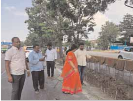
కర్నూల్ ఘాట్ ,మేజర్ న్యూస్ :డివైడర్ నిర్మాణంలో నాణ్యత ప్రమాణాలు పాటిస్తూ ప్రజలకు ఎలాంటి ఇబ్బందులు కలగకుండా , ట్రాఫిక్ సమస్య రాకుండా పనులు చేపట్టాలన్నారు .సాగర్ రింగ్