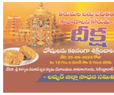
ప్రయాచిత్తా దీక్ష కు తాము వూర్తి మద్దతు ఇస్తున్నట్లు ఆయన పేర్కొన్నారు.