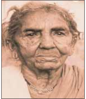
వెనుక ఆమె త్యాగం ఇమిడి ఉంది అని తెలిపారు.. ఐలమ్మ అంకాంక్షలకు అనుకూలంగానే తెలంగాణలో అనేక

ంచారు. ఈ సందర్భంగా ఆమె పోరాట స్ఫూర్తిని, గద్దర్ అభిమానుల సంఘం, గద్దర్ ద శం, అణగారిన ప్రజల హక్కుల పోరాట కమిటీ, తెలంగాణ అంబేద్కర్ యువజన సంఘం, జజ్జనక కళా మండలిలు స్మరించుకు న్నాయి.. అజిచి వేతకు గురైన తడితా, పిడిత, బదుగు బలహీనవర్గాల తిరుగుబాటు తత్వానికి ప్రతిఘటన పోరాటానికి చిట్టాల ఐలమ్మ స్ఫూర్తిగా నిలిచారన్నారు. తెలంగాణ సామజిక సాంస్కృతిక, ఆస్తిత్వ ఉద్యమాలలో స్వయం పాలన కోసం కొనసాగిన పోరాటలో, బహుజనులు భాగస్వామ్యం కావడం